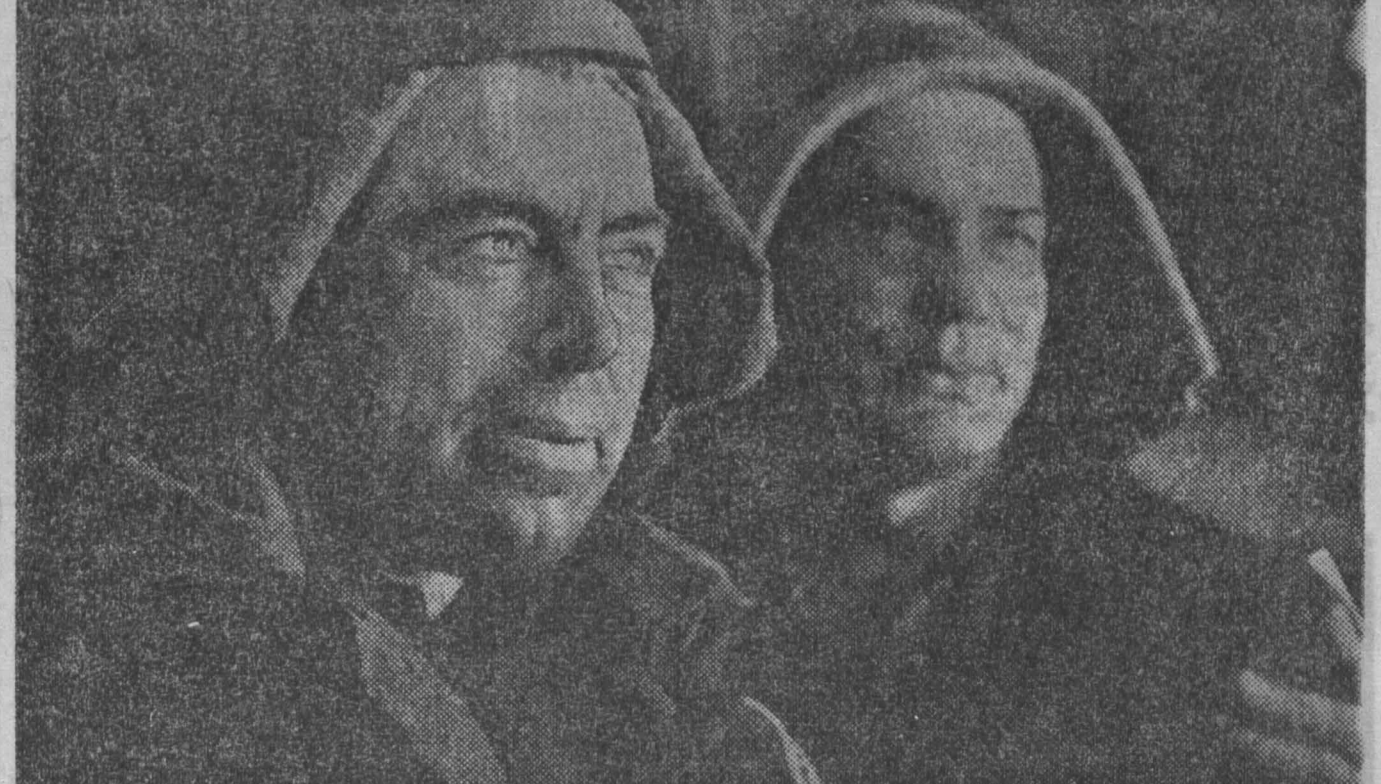
Два десятка лет поставляет свою продукцию на стройки Сибири Кемеровский завод минераловатных изделий. Отлично несут здесь трудовую ударную вахту в честь 50-летия образования СССР ветераны завода.