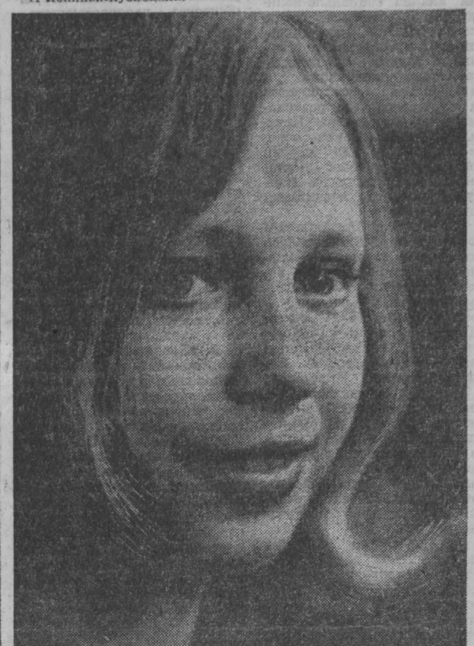
г. Ленинск-Кузнецкий.