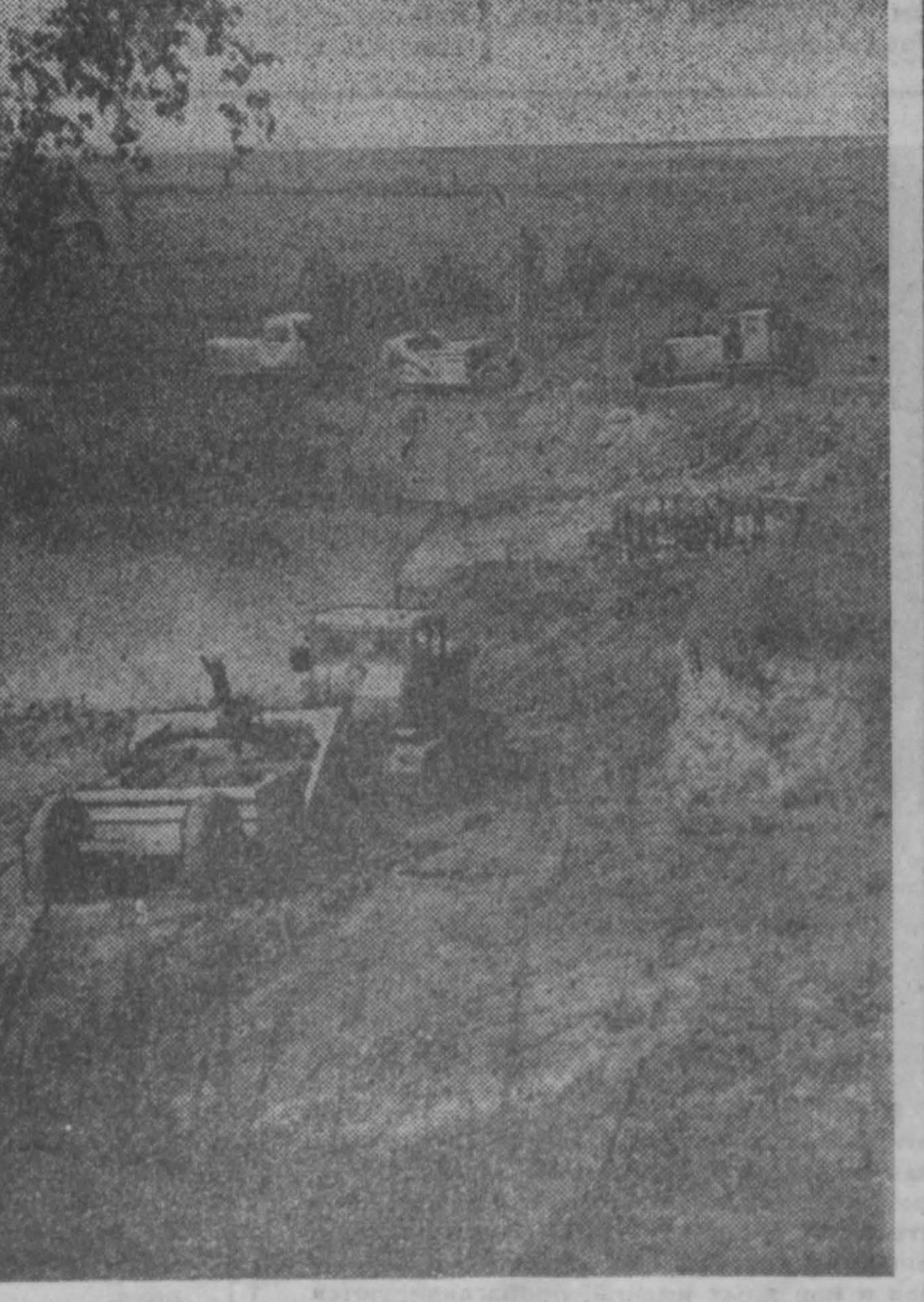
Кемеровский район.