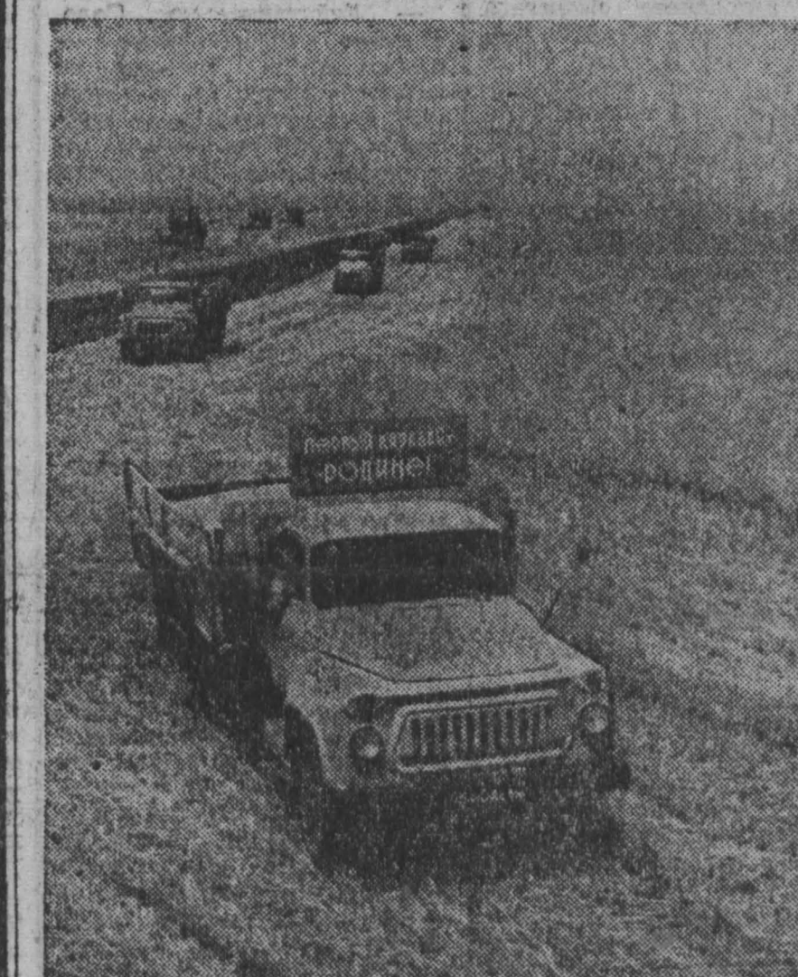
Мощным ролотом машин-ослаблены бескрайние поля Старополья. Жатка набирает темпы. Хлебоборозды мчат вперед убранные с полей, прерываемые да миллиона гектаров. Почти десять тысяч комбайнов выведены на поля. Около восьми тысяч тонн зерна, значительно больше плана, продает государство совхоз «Красноармейский» нефтекумского района. Темпы первых дней уборки высокие. Многие комбайнеры намечают за световой день более 400 центнеров пшеницы. НА СНИМКЕ: хлебная страда на полях совхоза.

7 июля в Кремле были завершены переговоры между Генеральным секретарем ЦК КПСС Л. И. Брежневым, членом Политбюро ЦК КПСС, Председателем Президиума Верховного Совета СССР Н. В. Подгорным, членом Политбюро ЦК КПСС, Председателем Совета Министров СССР А. Н. Косыгиным, членом Политбюро ЦК КПСС, секретарем ЦК КПСС А. П. Кириленко и Генеральным секретарем Партии арабской социалистической революции, Президентом Сирийской Арабской Республики Хафезом Асадом, возглавляющим партийно-правительственную делегацию Сирийской Арабской Республики. В ходе переговоров, продолжавшихся в течение, товарищам Генеральным секретарем ПАСВ, Президентом САР Хафезом Асадом, были рассмотрены вопросы дальнейшего развития дружественных отношений между Советским Союзом и Сирийской Арабской Республикой, между Коммунистической партией Советского Союза и Партией арабской социалистической революции, а также актуальные международные проблемы, в том числе положение на Ближнем Востоке. Стороны выразили удовлетворение развитием дружественных отношений и всестороннего сотрудничества между ними, готовности к их дальнейшему расширению и согласованному осуществлению соответствующих мероприятий. Стороны договорились опубличить совместное коммюнике об итогах состоявшихся переговоров советских руководителей с партийно-правительственной делегацией Сирийской Арабской Республики, возглавляемой Генеральным секретарем ПАСВ, Президентом САР Хафезом Асадом. (ТАСС).