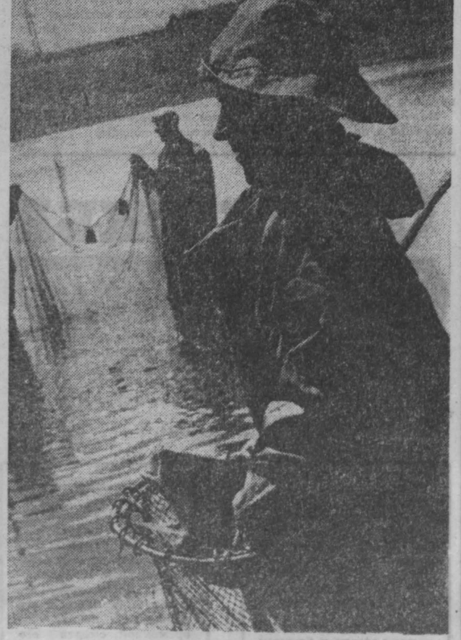
Десять лет назад недалеко от совхоза «Ягунский» появилось небольшое рыбное хозяйство — Кемеровский рыбхоз. Здесь впервые в Кузбассе стали выращивать карпов. Сейчас это большое, развитое хозяйство, площадь прудов которого 200 гектаров. Здесь же хозяйство ведет эксперименты по выращиванию различных сортов рыбы: судака, осетровых. Три года назад сюда впервые был привезен судак, и сейчас Кемеровский рыбхоз может уже вести его разведение в другие хозяйства области. В данное время работники заняты отловом личинок, которые будут пересажены в выростные пруды. Так закладывается фундамент на будущий год по снабжению области товарной рыбой.

Нынешь осенью вступают в строй пруды-питомники — 161 гектар. Заначивается и сооружение головного водохранилища на 230 га. Многие совхозы и колхозы пруды строят своими силами. Заначивается эта работа, например, в совхозе «Тамбарский» Тисульского района, где «голубая ферма» займет 225 га. 70 га прудов нынче вводится в совхозе «Демьяновский» Ленинск-Кузнецкого района. Почти на 150 га увеличивается в 1972 году площадь карповых прудов колхоза «Шуть к коммунизму» Промышленновского района. — Какая сегодня проводится работа на существующих «голубых гектарах» наших хозяйств? — В первой декаде июня на всех прудах прошел нерест. Личинка карпа пересаживается в выростные пруды. К осени это будет так называемая сеголетка, которая ровно через год станет товарной рыбой. Сегодня карп, обитающий в нагульных прудах, получает комбикорм, минеродобавки. План производства товарной рыбы на 1972 год — 1.030 центнеров. Пользуясь случаем, поздравляю с праздником — Днем рыбака — всех, кто занимается разведением, выращиванием и отловом рыбы, строительством прудов.