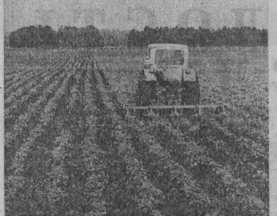
В совхозе «Заря» Промышленновского района картофельные поля отличаются чистотой и хорошими всходами.