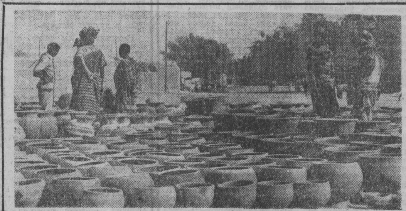
НА СНИМКЕ: гошарный ряд на базаре в Ниамее — столице Нигера.