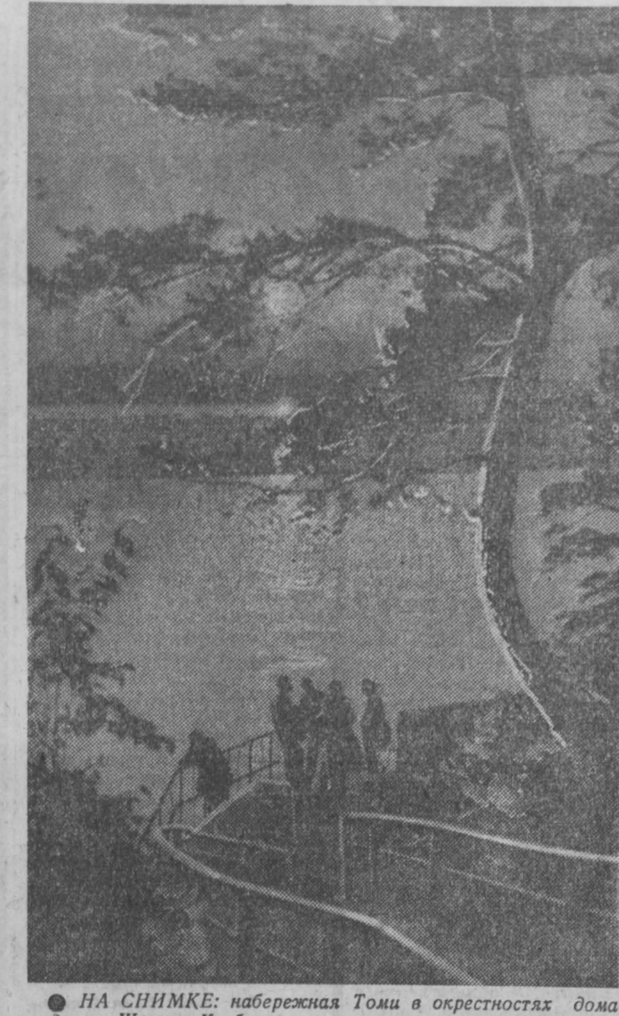
НА СНИМКЕ: набережная Томи в окрестностях дома отдыха «Шахтер Кузбасса».

В минувшее воскресенье поднимались мы на моторной лодке вдоль правого берега водохранилища. Между селами Камешок и Поморьево особенно многолюдно.