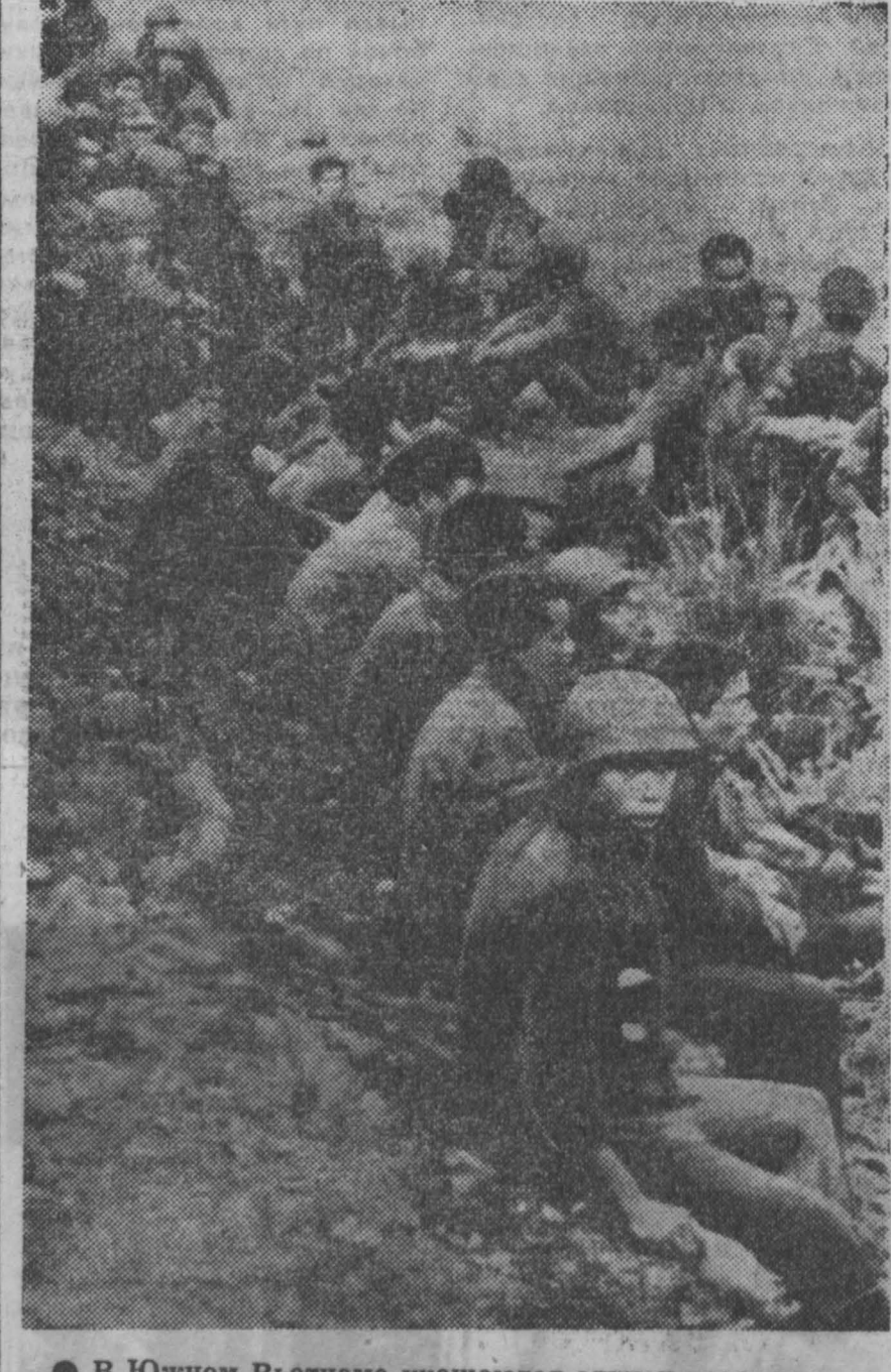
В Южном Вьетнаме учащаются случаи перехода солдат марionеточной армии с оружием в руках на сторону патриотов.