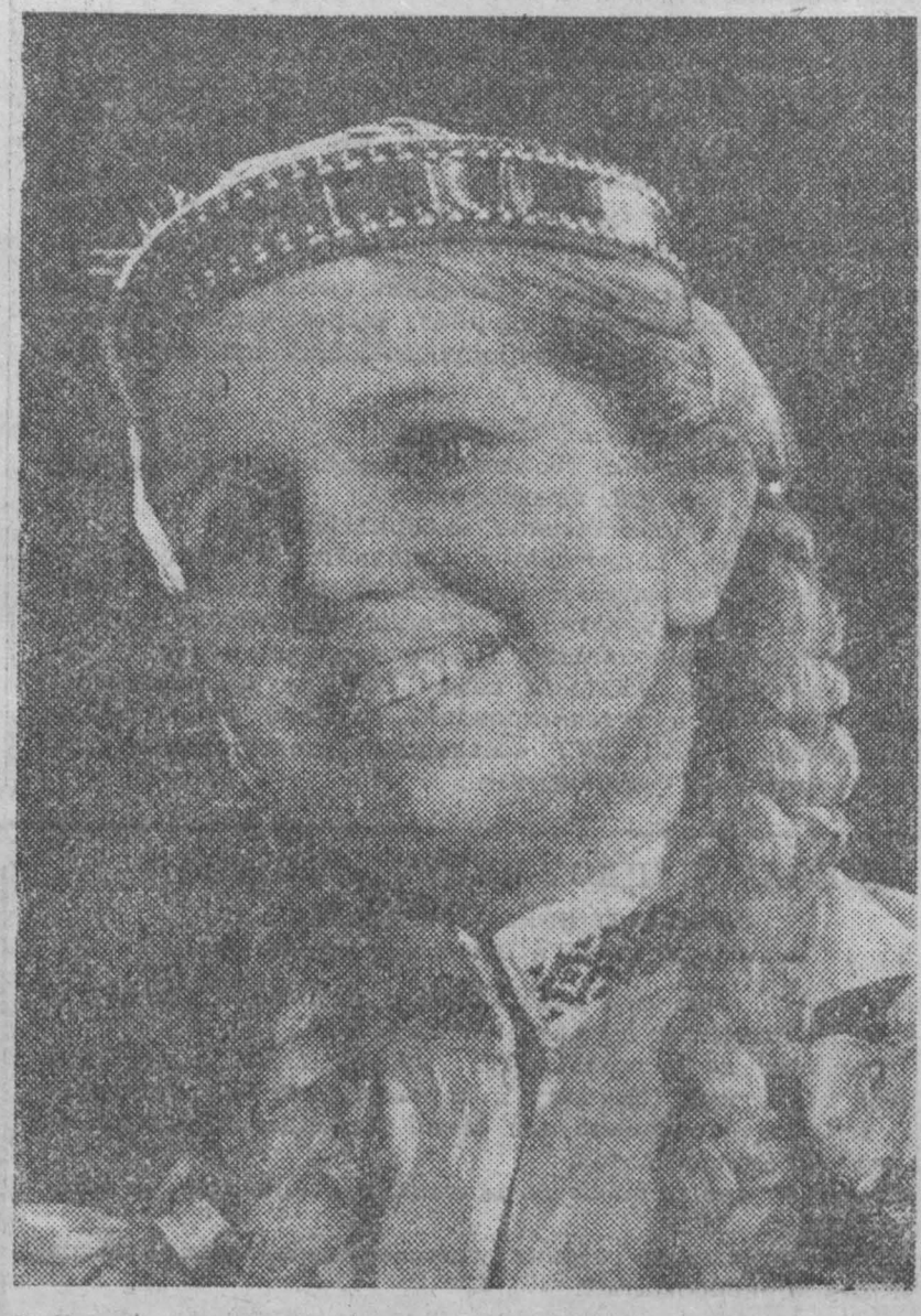
В Латвии славится ансамбль народного танца рижского завода ВЭФ «Ротал». В его составе — 50 артистов: рабочие, сотрудники модельных и долевых учреждений. Самостоятельные артисты неоднократно выступали в различных городах республики, была в Москве, выезжали на гастроли в Чехословакию, Польшу. ГДР. Сейчас ансамбль готовит новую программу, посвященную 50-летию образования СССР. В программе — танцы народов нашей страны.

М. РАМАН, заместитель Председателя Совета Министров Латвийской ССР, председатель Госплана республики.