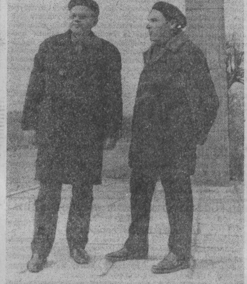
Давная дружба связывает рижских колхозников — латвийский «Авангард» и литовский «Артос». Колхозники помогают друг другу техникой, запасными деталями, семенами. Оба колхоза — передовые. «Авангард» является показательным в Латвии по выращиванию и уборке свеклы. «Артос» достиг высоких показателей в производстве продукции животноводства, строит много добротных жилых домов.