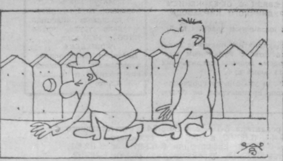
СИЛА ПРИВЫЧКИ. Рис. В. Андрианова.