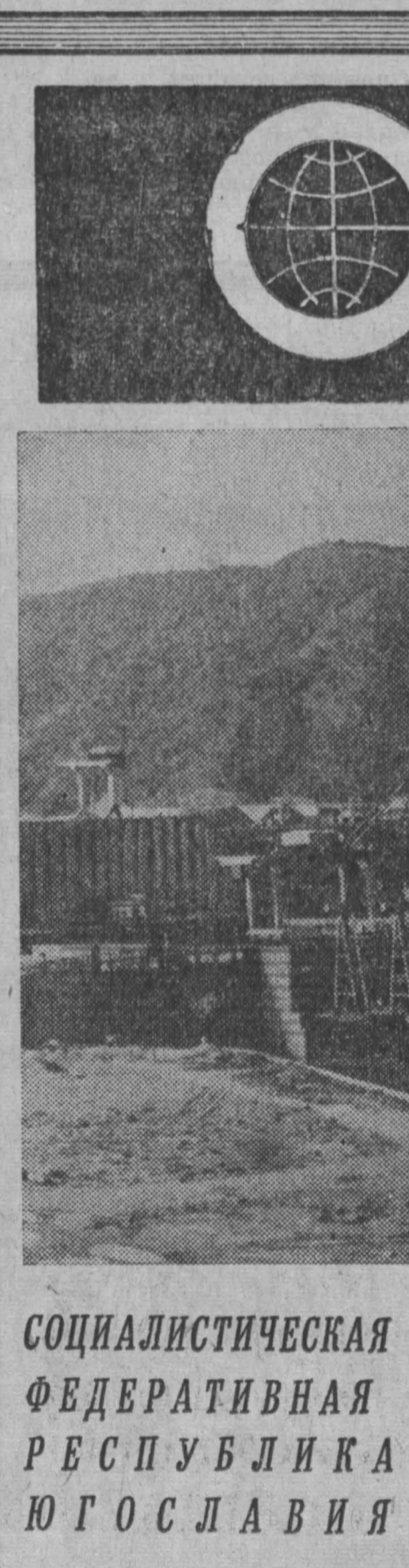
НА СНИМКЕ: общий вид гидроэнергетического комплекса «Джерадан».

В Приморском крае — в начале и в конце первой декады, в отдельные дни второй и третьей — пасмурно, дожди, грозы.