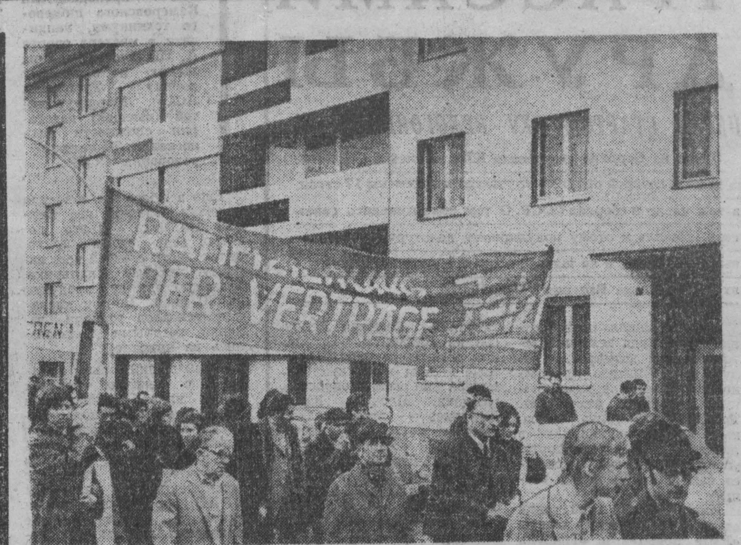
В ФРГ усиливается накал политической борьбы вокруг ратификации договоров с СССР и ПНР. Несмотря на ожесточенное сопротивление оппозиции, фронт сторонников нормализации отношений с социалистическими государствами постоянно расширяется.