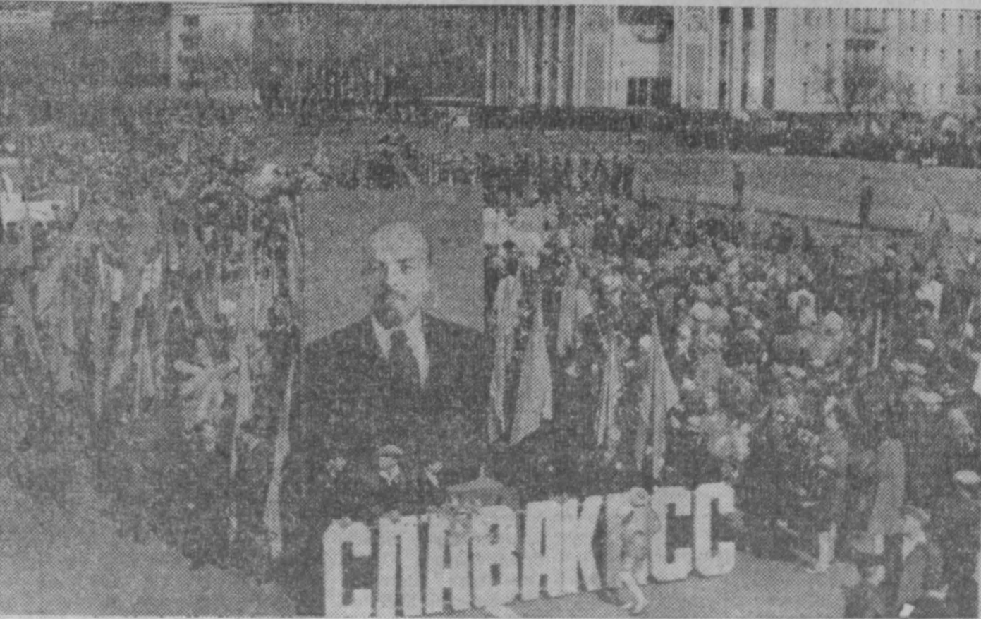
НА СНИМКЕ: митинг в Кемерове.

внешнеполитическая программа Советского Союза неукольно претворяется в жизнь. Мы стали свидетелями многочисленных акций и мирных инициатив на международной арене, пользующихся поддержкой всех прогрессивных сил нашей планеты. С каждым днем пополняются ряды многочисленной армии борцов за мир. Успехи этого благородного дела во многом зависят от усилий мировой общественности, еще большей активизации движения сторонников мира. 21 апреля с. г. Комитет по международным Ленинским премиям «За укрепление мира между народами» принял постановление о присуждении международных Ленинских премий видным общественным и политическим деятелям из зарубежных стран. Звания лауреатов этой высокой премии за 1970—1971 годы удостоены: Э. Х. С. Буроп (Англия), Ренато Гуттузо (Италия), Цола Драгойчева (Болгария), Камаль Джумблат (Ливан), Эрнст Буш (ГДР) и Альфредо Варела (Аргентина). Профессор Эрик Хенри Стоуни Буроп — крупный английский ученый, специалист по ядерной физике — известен