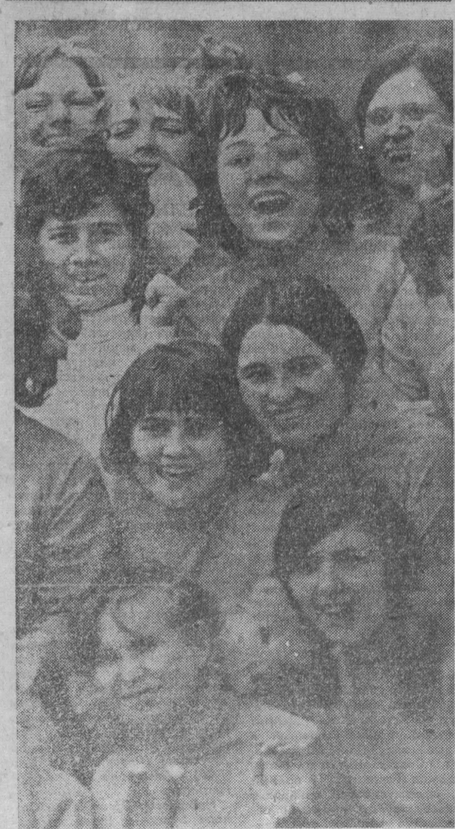
Демонстрация трудящихся областного центра.