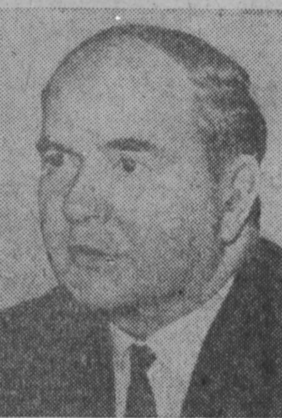
Э. Х. С. БУРОП

За выдающиеся заслуги в борьбе за сохранение и укрепление мира присудить международные Ленинские премии «За укрепление мира между народами»: Э. Х. С. Буропу — ученому, президенту Всемирной федерации научных работников (Англия); Ренато Гуттузо — художнику, общественному деятелю (Италия); Цола Драгойчева — общественной и политической деятельнице (Народная Республика Болгария); Камаль Джумблат — общественному и политическому деятелю (Ливан); Эрнсту Бушу — деятелю искусств (Германская Демократическая Республика); Альфредо Варела — писателю, общественному деятелю (Аргентина). Москва, 21 апреля 1972 г.