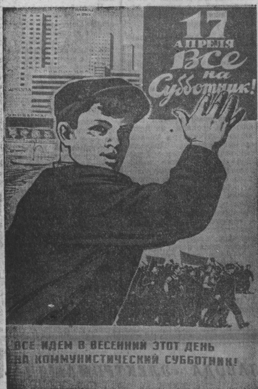
ВСЕ ИДЕМ В ВЕСЕННИЙ ЭТОТ ДЕНЬ НА КОМУНИСТИЧЕСКИЙ СУББОТНИК!