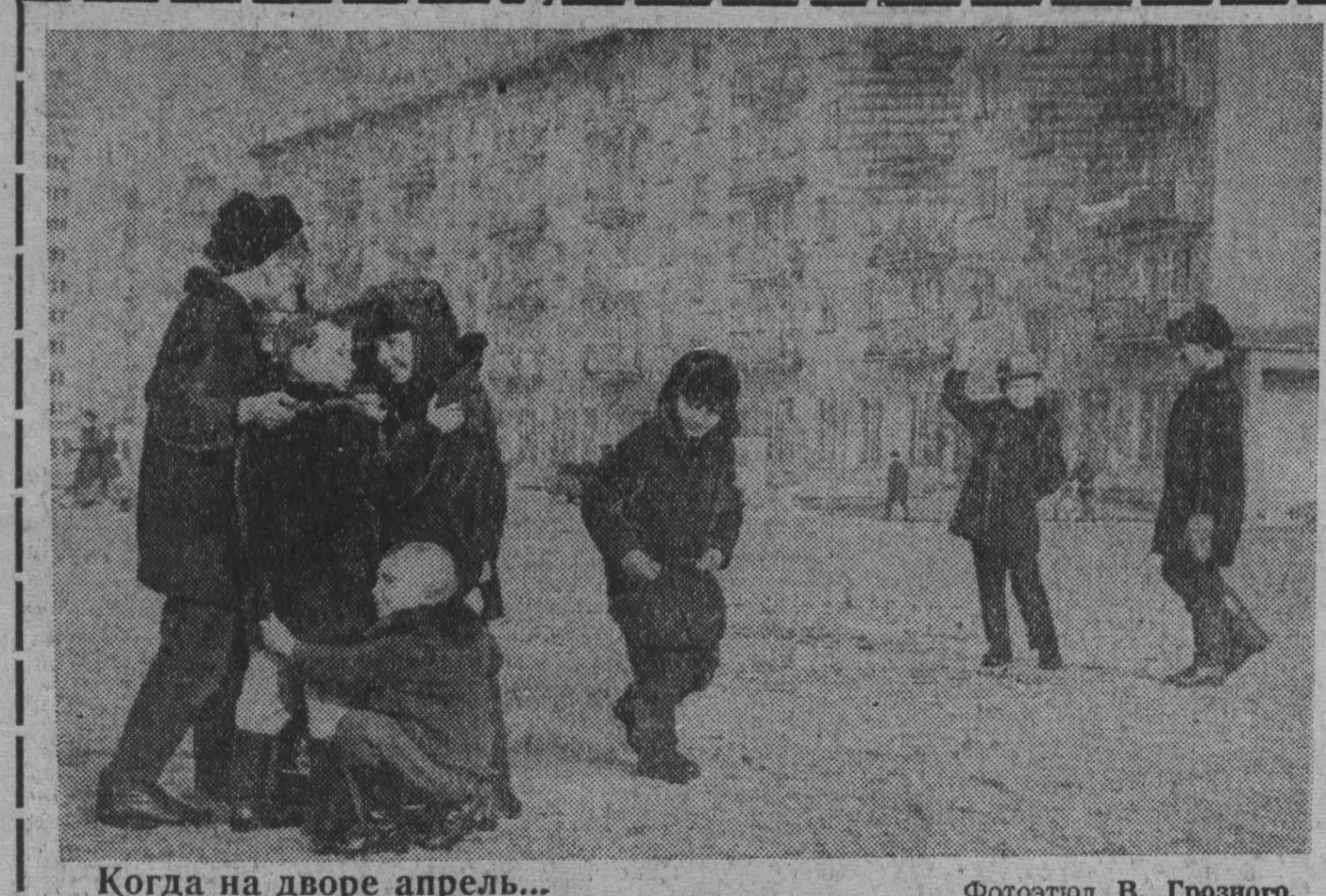
Когда на дворе апрель...