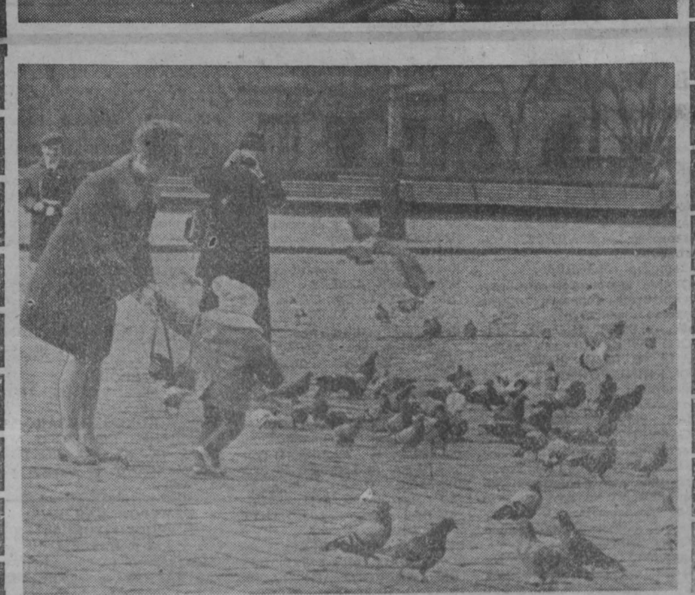
Живая реклама. Недалеко от здания выставки «Интерпрессфото-70». Чайки над Влтавой. Дети, голуби, мирная жизнь...