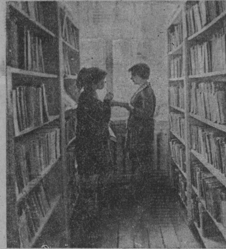
Большой популярностью у жителей пользуется библиотека в селе Сосновка Новокузнецкого района, содержащая более 18 тысяч томов политической, научной, технической и художественной литературы.