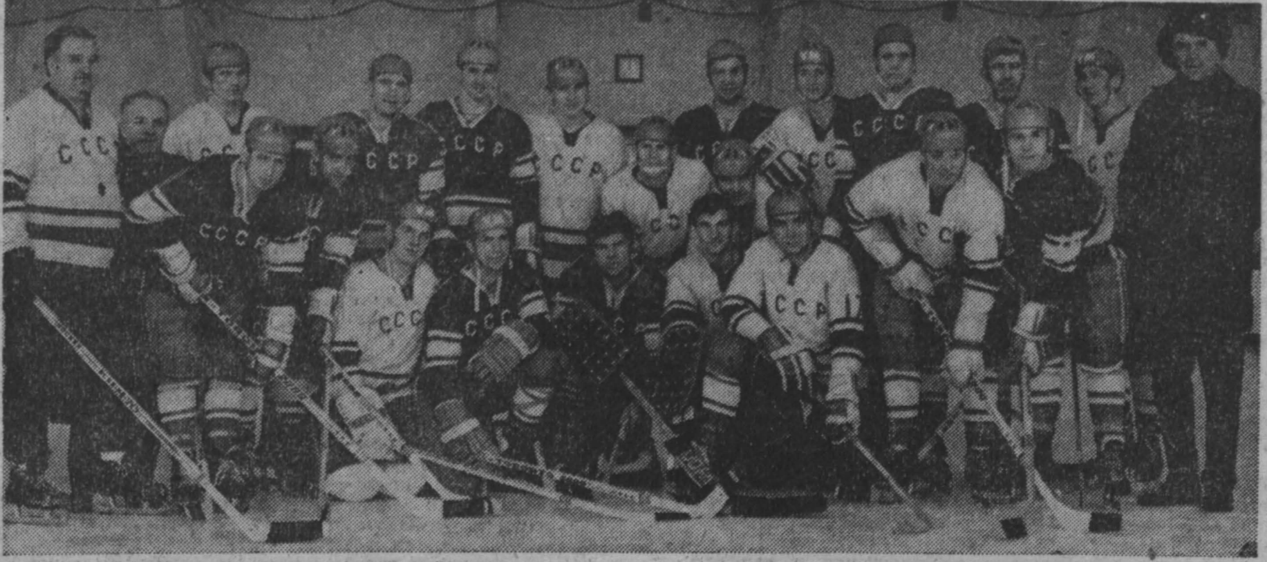
ЖЕНЕВА, 3 апреля. (ТАСС). Победив в заключительном матче команду Швеции со счетом 6:3 (2:1, 0:2, 4:0), советские хоккеисты вновь стали чемпионами мира.