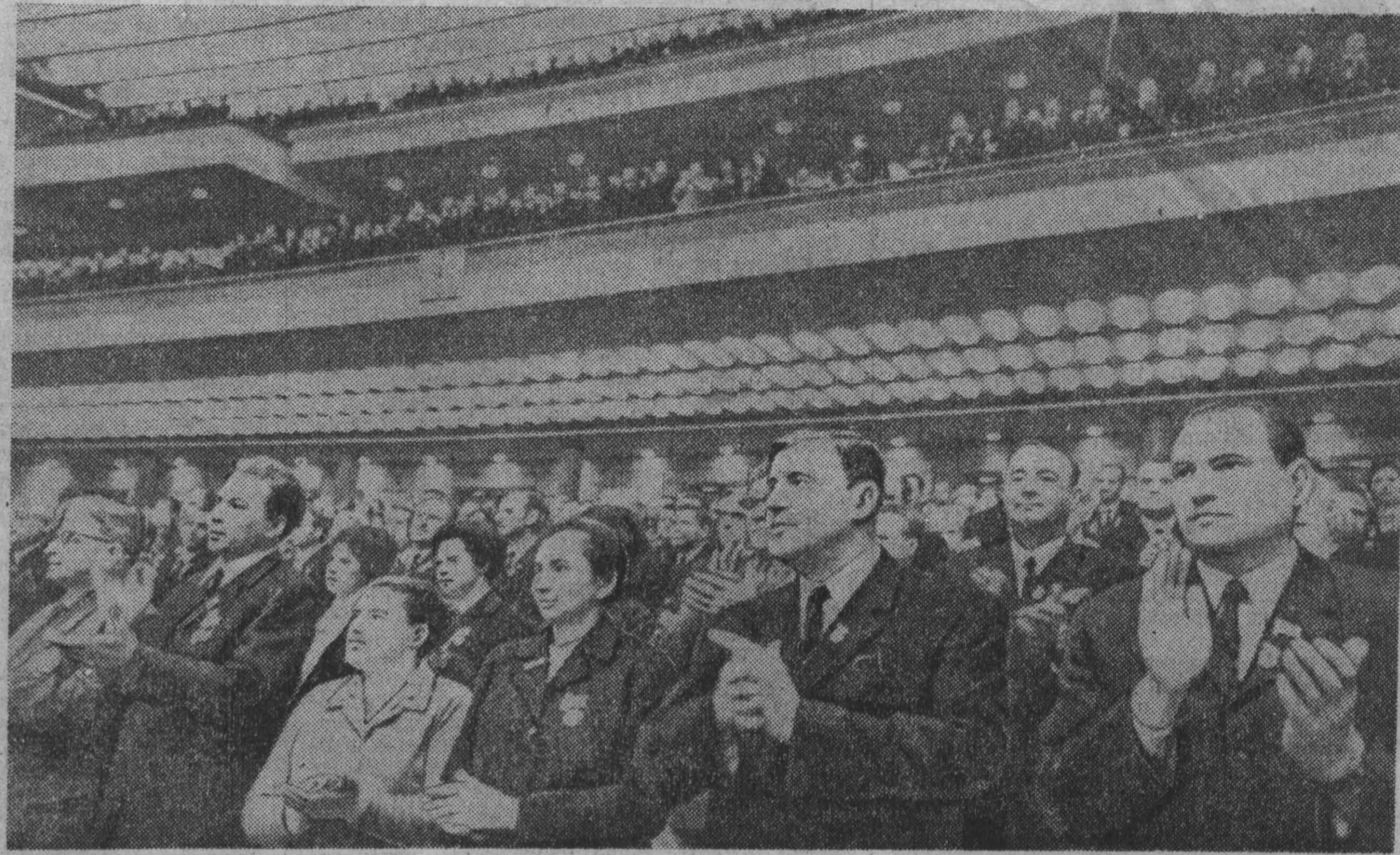
МОСКВА. Открытие XXIV съезда КПСС. В зале заседаний Кремлевского Дворца съездов. (ТАСС). (Принято по фототелеграфу).

СЪЕЗД ПРИВЕТСТВОВАЛ ГОРЯЧО ВСТРЕЧЕННЫМИ ДЕЛЕГАТАМИ И ГОСТЯМИ ТОВАРИЩАМИ Г. В. ПЕРВЫЙ СЕКРЕТАРЬ ЦЕНТРАЛЬНОГО КОМИТЕТА ПАРТИИ ТРУДЯЩИХСЯ ВЬЕТНАМА.