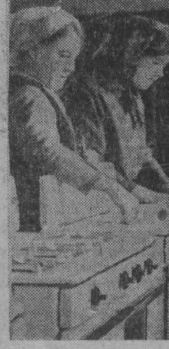
ТАТАРСКАЯ АССР. Выпускные приборы, выпускаемые Казанским заводом газовой аппаратуры, известны далеко за пределами республики. 175 тысяч трехконфорочных плит со встроенными газовыми баллонами будет отправлено в этом году сельскому населению Сибири, Средней Азии, Украины, в северные районы страны.

Животноводы совхоза в 1970 году получили в среднем от каждой коровы свыше четырех тысяч килограммов молока.