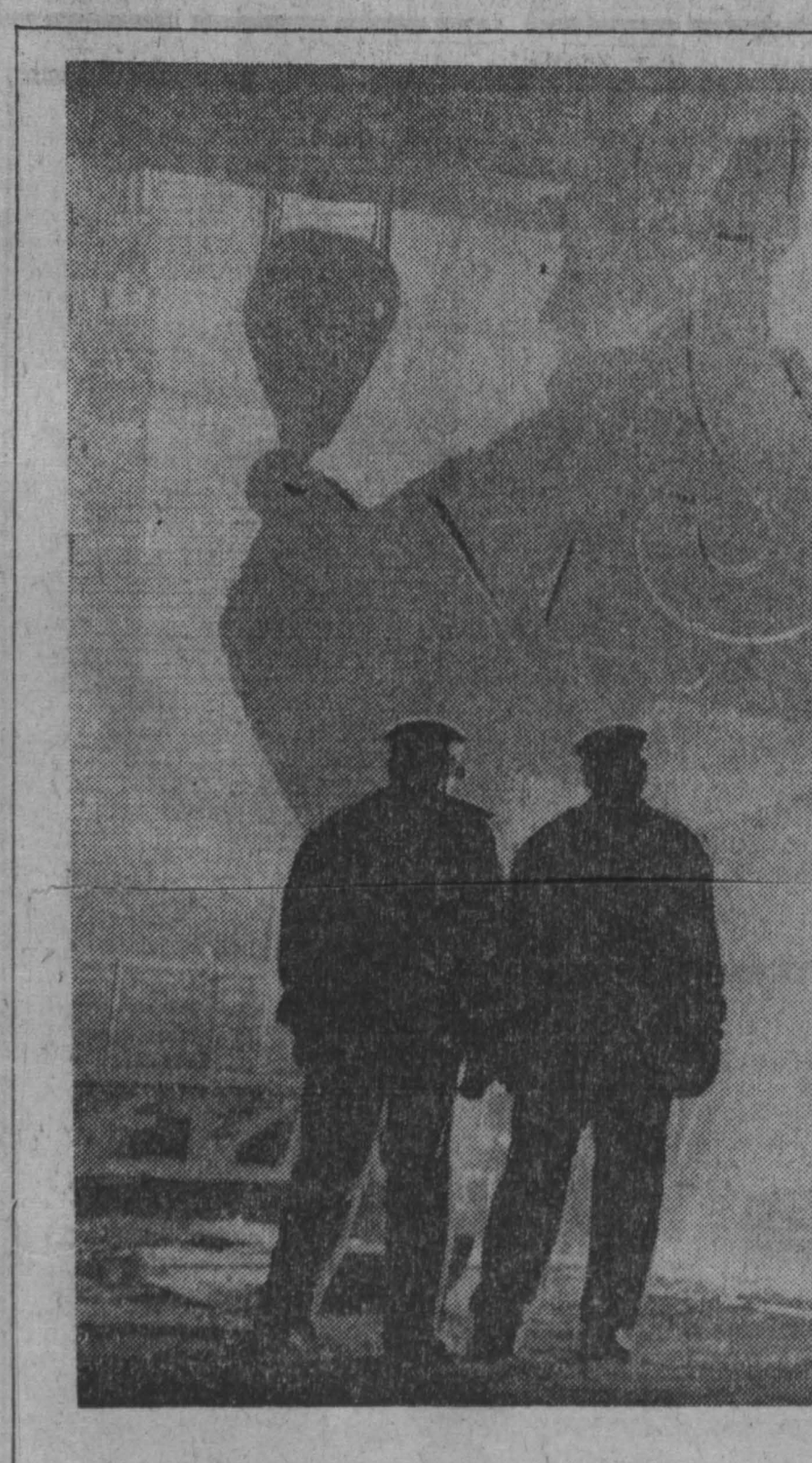
КУЗНЕЦКИЕ металлурги на предсезонной вахте. Доменщики, сталелары, прокатчики и коксохимники досрочно справились с планом минувшей пятилетки. Январский план новой пятилетки кузнечные также выполнили успешно. К предстоящему съезду КПСС коллектив Кузнецкого металлургического комбината имени Ленина обязался выплавить сверх плана 3 тысячи тонн стали, прокатать полторы тысячи тонн металла. НА СНИМКЕ: заливка чугуна в мартиновскую печь. г. Новокузнецк.