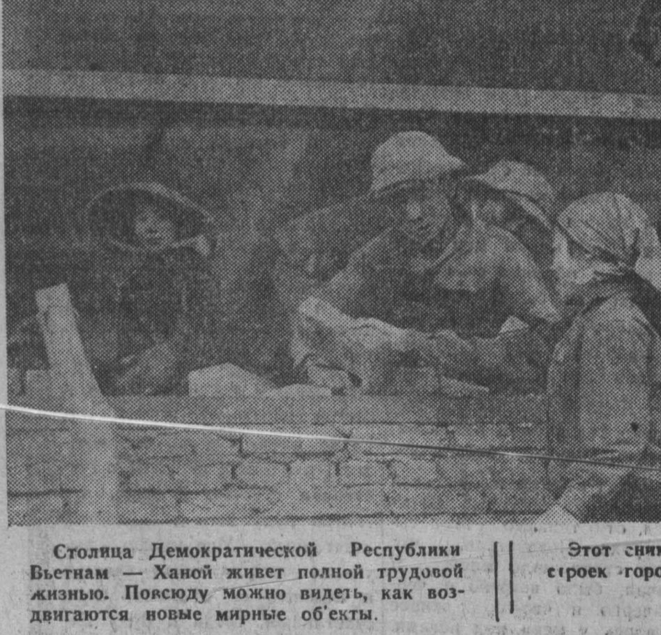
Страница Демократической Республики Вьетнам — Ханой живет полной трудовой жизнью. Повсюду можно видеть, как воздвигаются новые мирные объекты.