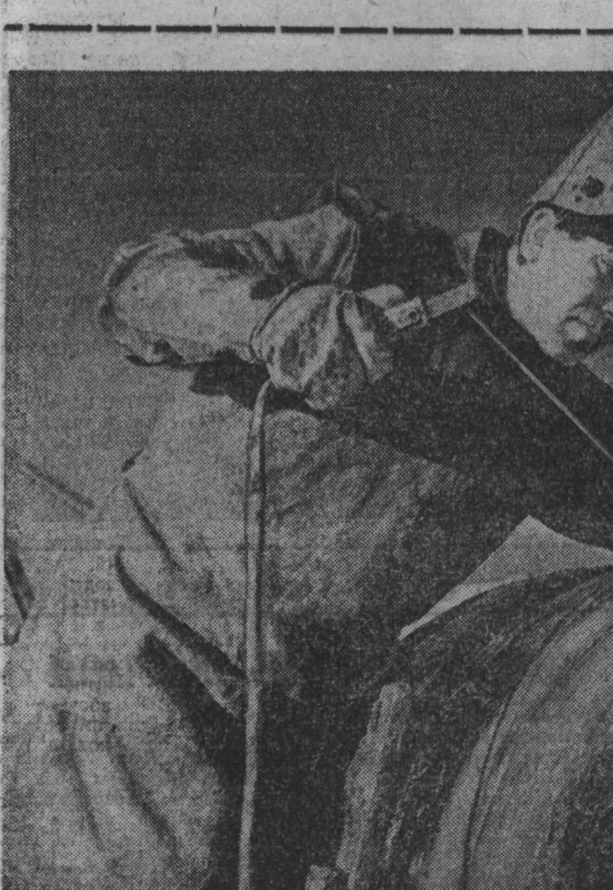
ВАРШАВА. (ТАСС). Польские шахтеры, правообладатели соревнований за перевыполнение плановых заданий, взяли обязательство выдать в этом году сверх плана на-гора не менее 900 тысяч тонн угля. Уже начало года они ознаменовали замечательной трудовой победой — в январе и первой половине февраля страна получила дополнительно 150 тысяч тонн угля.