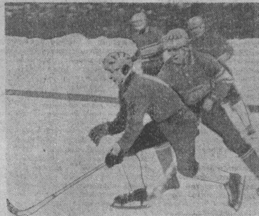
● НА СНИМКЕ: момент игры.