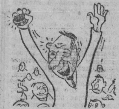
През больницы. Рис. А. Смирнова.

Хоккей с шайбой. На Московском международном турнире в субботу сборная СССР выиграла у команды ЧССР — 5:2. Хоккеисты Финляндии победили шведскую команду «Викинг» — 4:1.