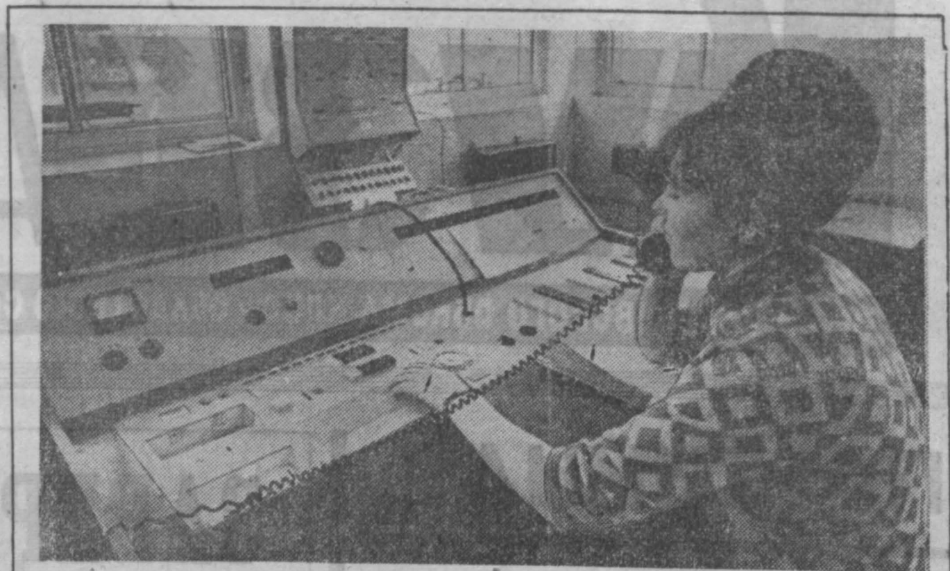
НА КРАСНОГОРСКОМ УГОЛЬНОМ...

Все эти новшества, образованная организация труда позволили бригаде за один только год сэкономить на