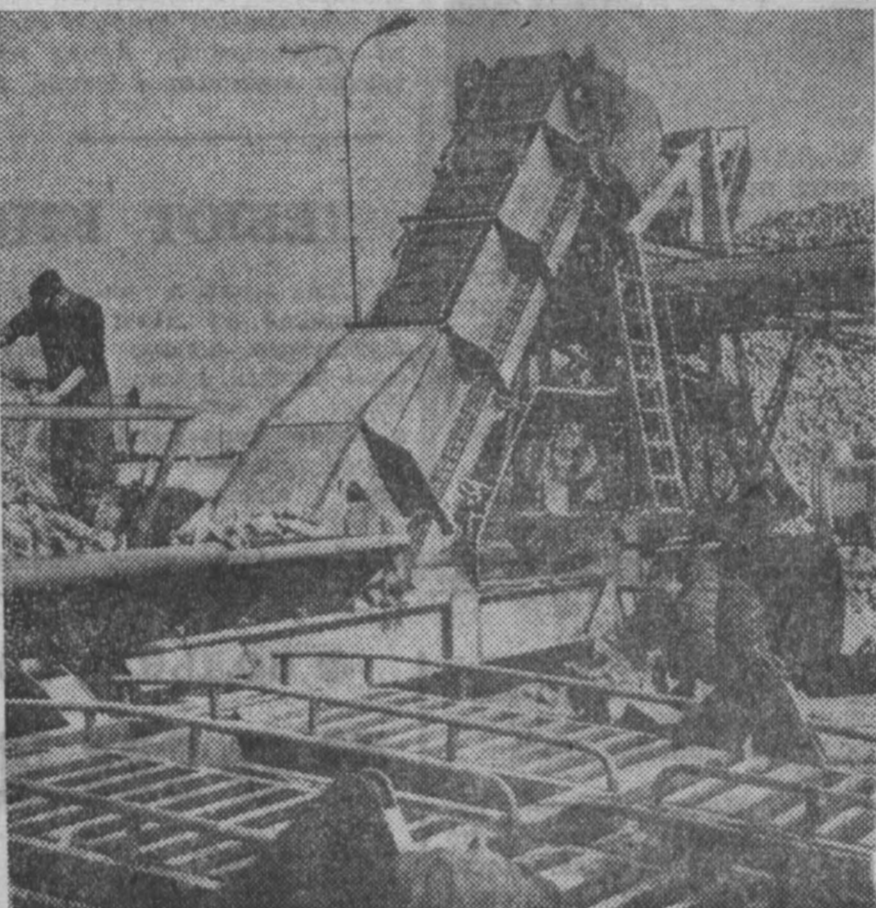
В Польской Народной Республике в разгаре сезон сахароварения. На заводе ежедневно поступают тысячи тонн сахарной массы. Сейчас народная Польша занимает одно из ведущих мест в мире по производству сахара.