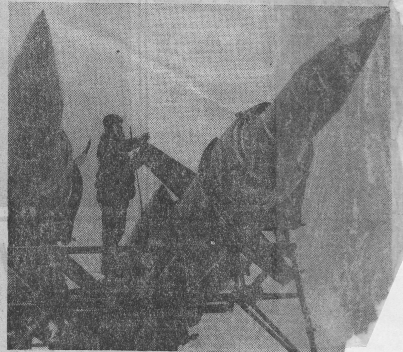
НА СНИМКЕ: ракетчики прибыли в район учебных занятий.