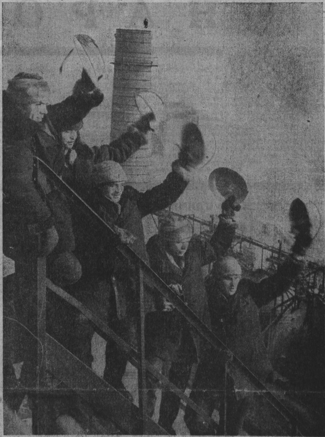
Сибирские домноростители осуществили сборку третьей домновой печи. Новая домна — третья «печка», как ласкательно называют ее строители, — будет крупнейшей в Союзе. На комплексе широко применена телевизионная связь и электроника.

Горняки шахты обязались в день субботника выдать наоборудованную тысячу тонн угля. Г. ОТЕВ, инструктор горкома КПСС. г. Междуреченск.