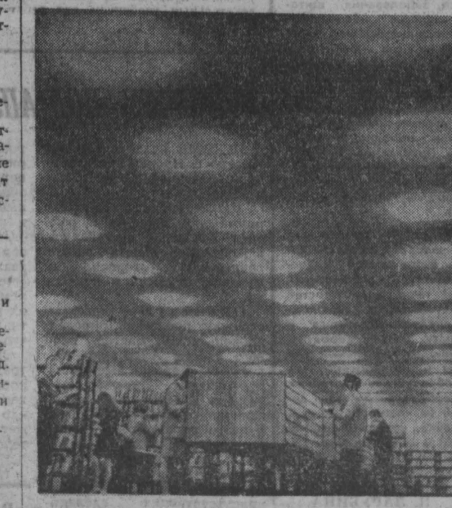
Более 9 тысяч библиотек работает в народной Венгрии. Большие денежные средства ассигнуются в стране на расширение библиотечной сети, на пополнение и обновление книжного ассортимента. НА СНИМКЕ: в новой библиотеке, недавно открытой в городе Сомбатей.