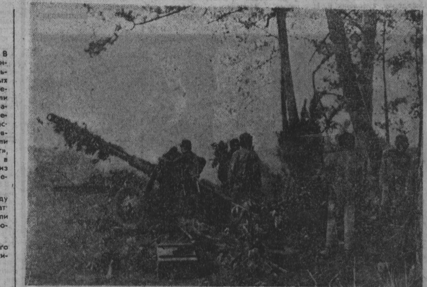
Части Народно-освободительной армии Лаоса продолжают наносить удары по противнику. За последние месяцы только в районе Саянгуан лаосские патриоты вывели из строя около 1.800 вражеских солдат. НА СНИМКЕ: артиллеристы Народно-освободительной армии ведут огонь по укрепленным противника в районе Саянгуан.