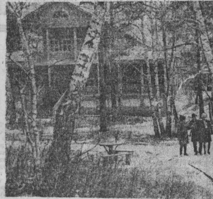
Тысячи трудящихся Кузбасса: шахтеры и строители, металлурги и машиностроители — люди разных профессий, пенсионеры отдыхают в этом году в Верхотурском доме отдыха. Все, что приезжает сюда, любуется прекрасным пейзажем, который открывается с высокого берега Томи. НА СНИМКЕ: на прогулке. г. Кемерово.