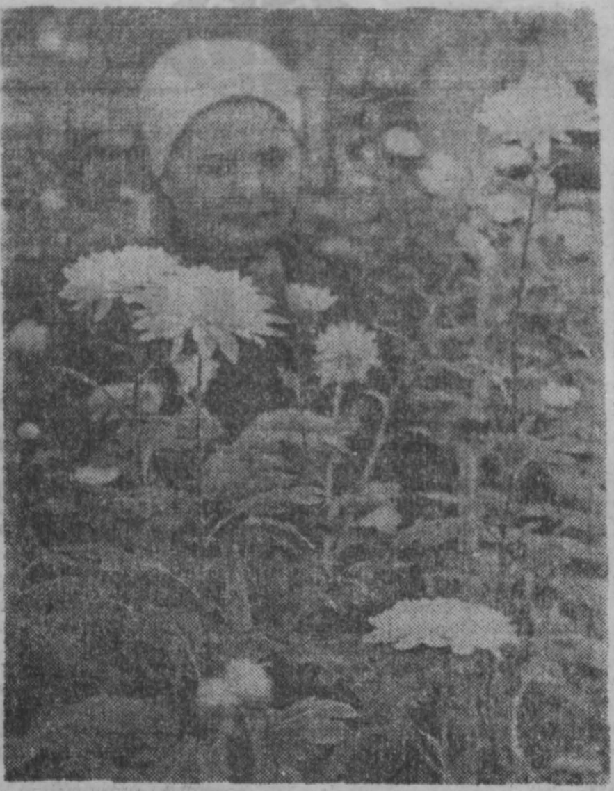
В теплицах Кемеровского РСУ «Горзеленстрой» работница вырастила цветы — это их подарок горожанам к празднику Великого Октября. Здесь хризантемы, каллы, гвоздики, астры и другие. Эти цветы поступили в продажу.

Среди поселковых Советов депутатов трудящихся первое место с вручением переходящего знамени, почетной грамоты и денежной премии в сумме 450 рублей присуждено Малиновскому поселку города Осинников.