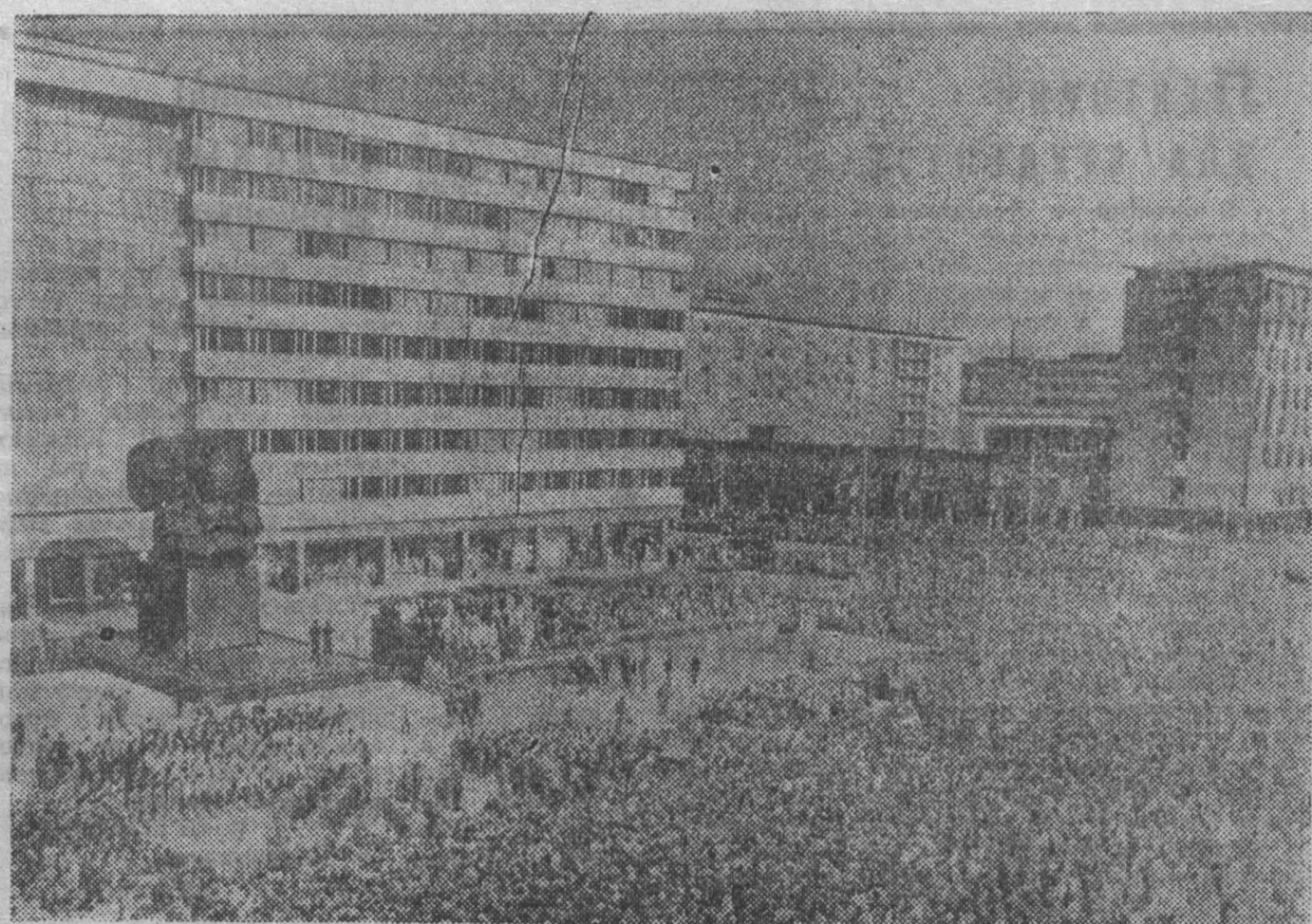
ГДР. Около 300 тысяч жителей города Карл-Маркс-Штадта присутствовало на митинге, посвященном торжественному открытию памятника основоположнику научного коммунизма Карлу Марксу. Автор