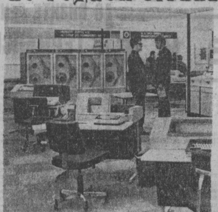
В Ленинграде открылась специализированная выставка периферийного оборудования и средств оргтехники...