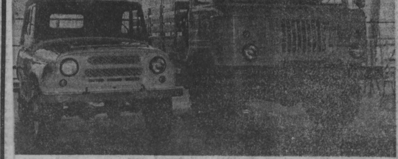
МОСКВА. Лучшие промышленные предприятия страны, выпускающие сельскохозяйственную технику, ведущие научные учреждения, более 30 министерств и ведомств примут участие в экспозиции «Наука и техника — сельскому хозяйству», посвященной успехам социалистического земледелия и животноводства.

— Какие старты ожидают наших ведущих спортсменов? — Могут образоваться победители зимних видов спорта. Принято решение сделать Кемерово центром зонального первенства Сибири в зачет VII спартакиады профсоюзов. Лучшие спортсмены восьми областей и краев Сибири поведут здесь спор за звание сильнейших. Борьба будет острой и напряженной: ведь только команды победительницы получают путевку на финал спартакиады. Напряженной будет борьба и в каждом виде состязаний за звание чемпионов, который, независимо от успеха команды, получает путевку в финал.