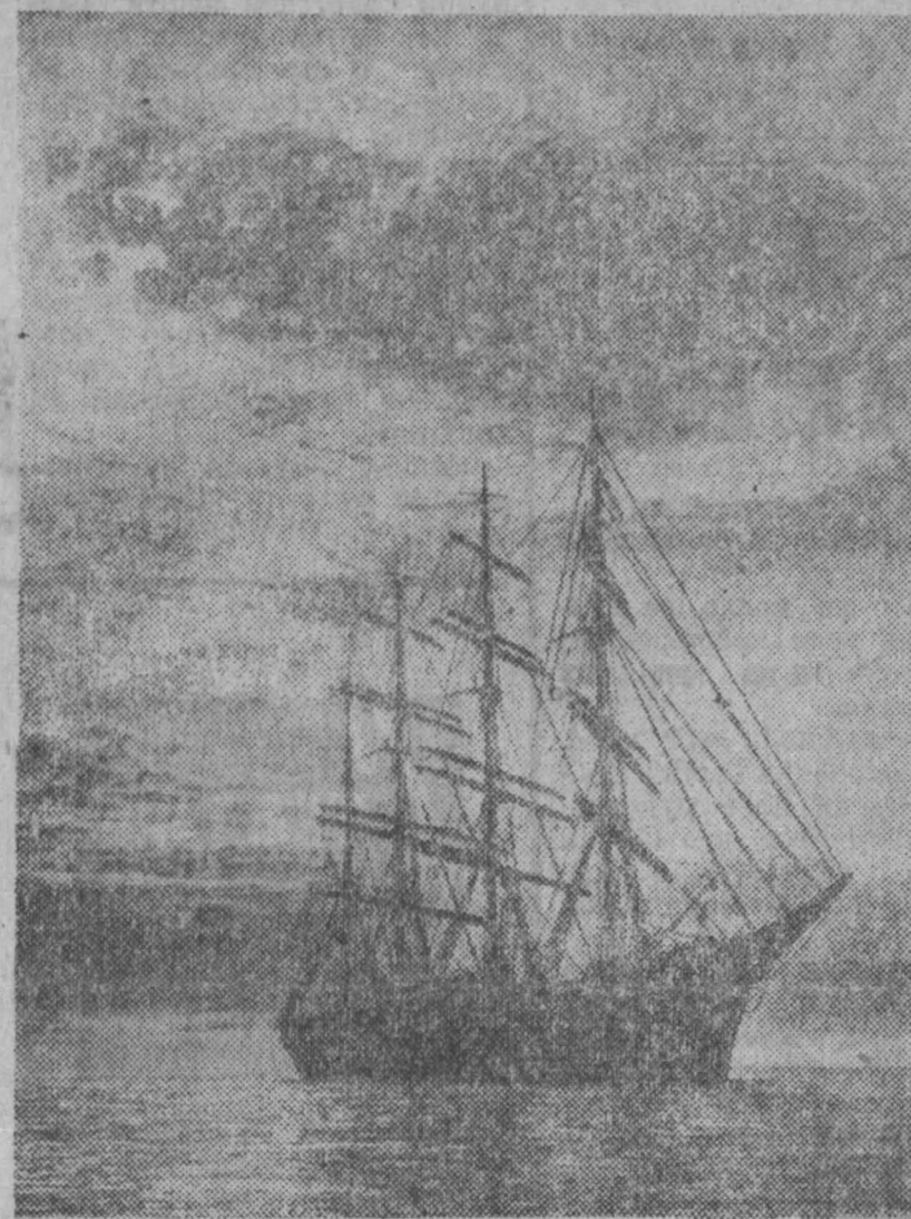
НА СНИМКАХ: Листовки • Виноградарь • Вечер на рейде.