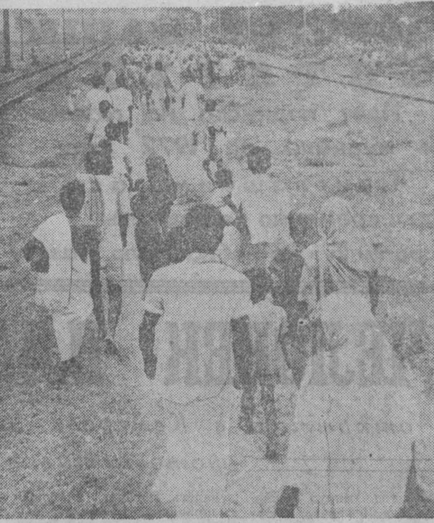
Однако положение беженцев остается тяжелым. В лагерях вспыхивают эпидемии желудочно-кишечных заболеваний в результате антисанитарных условий и нехватки. Особенно страдают старики и дети. Около двух миллионов человек еще не нашли крова, работы.

По официальным данным, их число достигает 10 миллионов человек. Ежедневно границу переходят до 40 тысяч пакистанцев. Это объясняется непрекращающимися репрессиями, обрушенными западнопакистанской армией на жителей Восточного Пакистана.