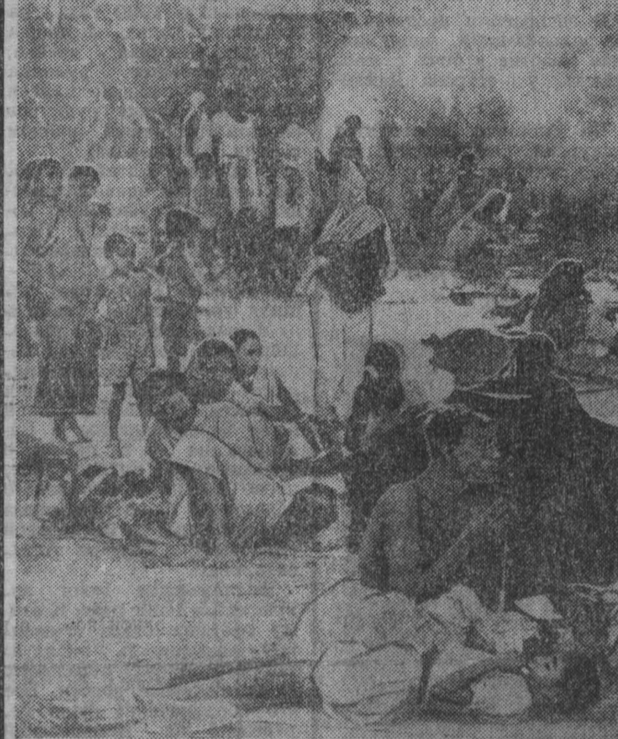
ИНДИЯ. Несмотря на тяжелое положение восточнопакистанских беженцев в лагерях, то, от чего они бежали, еще страшнее. В памяти каждого из этих людей живы картины убийств, насилий, жестокостей...