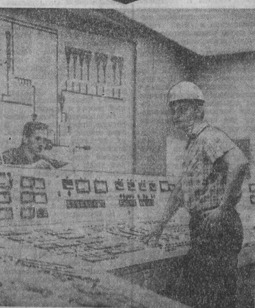
Своим трудом они участвуют в выполнении пятилетнего плана республики (1971—1975 гг.). НА СНИМКЕ: на пути управления.

ГДР. Широко развернулось социалистическое соревнование на цементных заводах «Фортигит» («Прогресс») в Бернбурге.