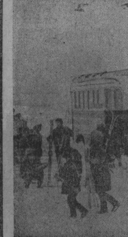
Позади все тридцать матчей первого круга. Ровно, без срывов выступают юные прокупецкого «Шахтера» (тренер Г. Бедарева). В пяти победных встречах они забросили в ворота соперников шестьдесят шайб, а в свои пропустили только девять. Особенно приятна победа прокупецкого (9:3) над сверстниками «Сибиряки», идущими на втором месте. Команда «Металлурга» входит в призную тройку.