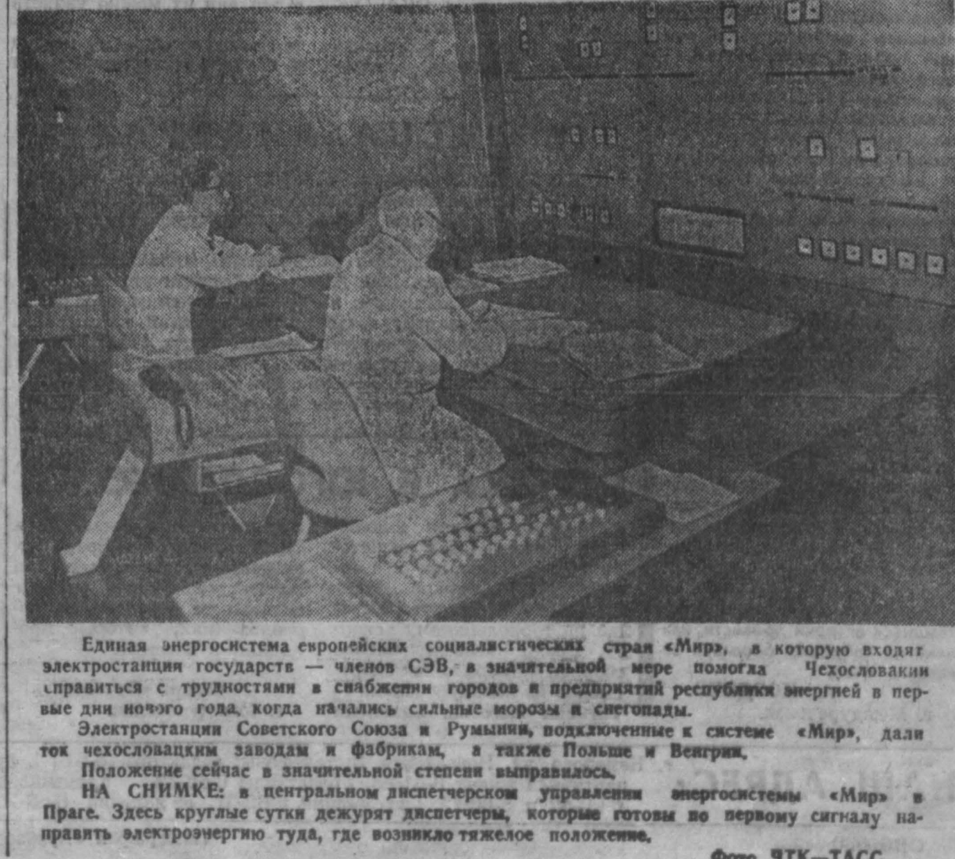
Единая энергосистема европейских социалистических стран «Мир», в которую входят электростанции государств — членов СЭВ, в значительной мере помогла Чехословакии справиться с трудностями в снабжении городов и предприятий республикой энергией в первые дни нового года, когда начались сильные морозы и снегопады. Электростанция Советского Союза в Румынии, входящая в систему «Мир», дала ток чехословацким заводам и фабрикам, а также Польше и Венгрии. Положение сейчас в значительной степени выправилось. НА СНИМКЕ: в центральном диспетчерском управлении энергосистемы «Мир» в Праге. Здесь круглые сутки дежурят диспетчеры, которые готовы по первому сигналу направлять электроэнергию туда, где возникло тяжелое положение.

волюционное правительство создало широкую сеть школ-интернатов и полунтернатов, где дети трудящихся обеспечиваются бесплатным питанием, одеждой, обувью, учебниками. Классные помещения хорошо оборудованы. Дети имеют все возможности заниматься музыкой, спортом, весело отдыхать.