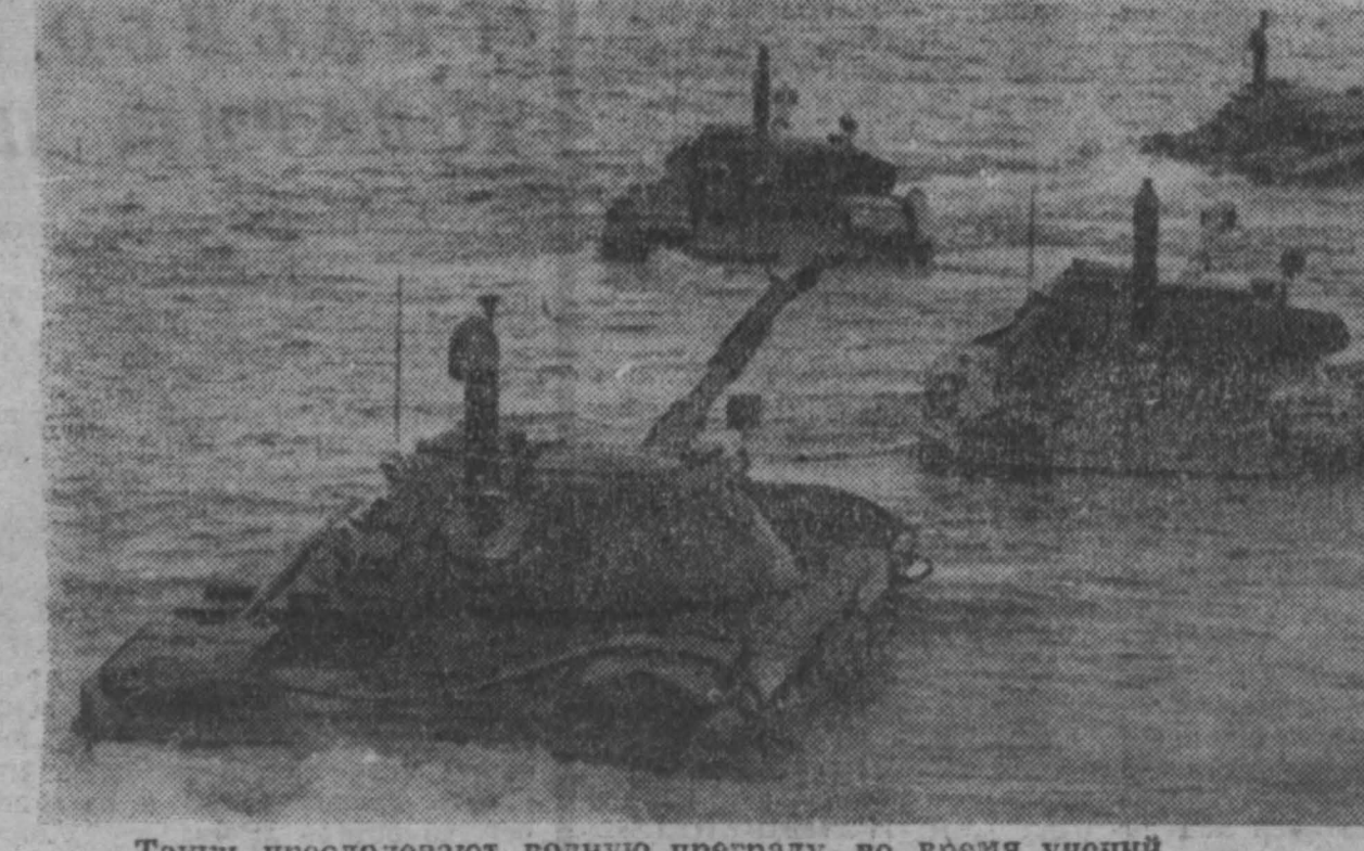
Танки преодолевают водную преграду во время учений.

Советский народ и его Вооруженные Силы 12 сентября отмечают День танкистов. Этот праздник учрежден четверть века назад в честь особо выдающихся заслуг воинов-танкистов на полях сражений Великой Отечественной войны, в честь заслуг советских танкистов.