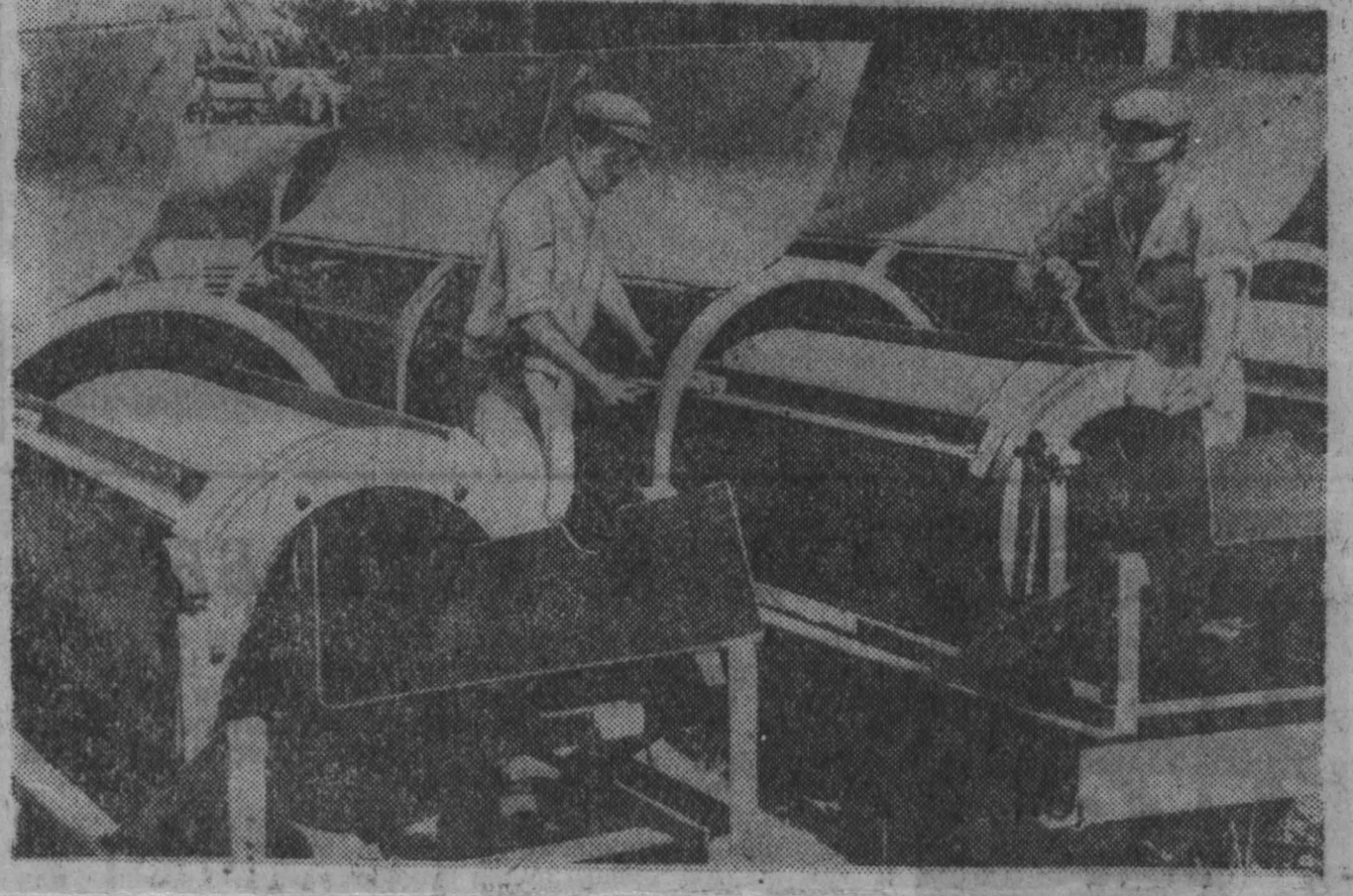
ДЕМОКРАТИЧЕСКАЯ РЕСПУБЛИКА ВЬЕТНАМ. Рабочие Ханойского механического завода на две недели раньше срока выполнили полугодовой производственный план и дали стране высококачественные машины для нужд сельского хозяйства и промышленности.