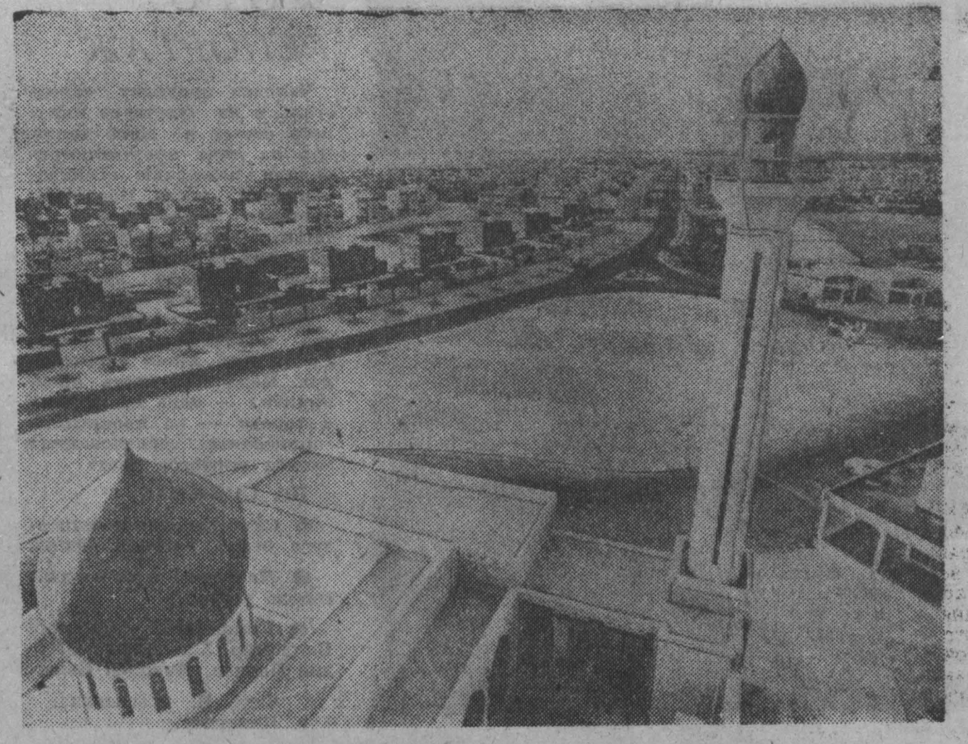
Арабское киждество (шейхство) Бахрейн расположено на живописном архипелаге у восточного побережья Аравийского полуострова. Это один из бывших протекторатов Англии, самое крупное и богатое нефтью киждество Персидского залива.

Печать предсказывает исключительно острейшие дебаты во время работ американско-японского совместного экономического комитета.