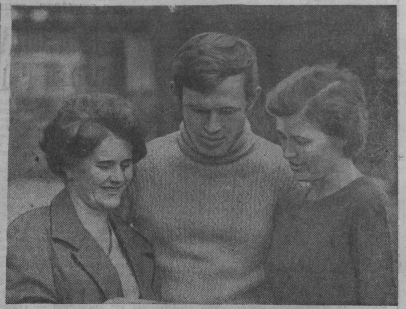
ГАЗЕТЫ И ЖУРНАЛЫ — В КАЖДУЮ СЕМЬЮ!