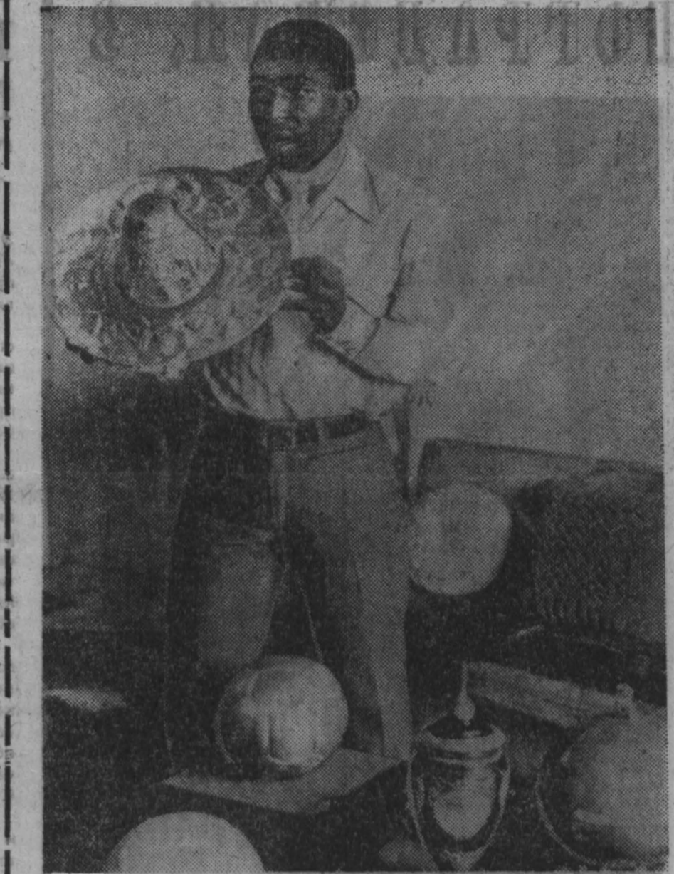
Футбольным сувенирам Пеле мог бы позавидовать и король футбола, не менее чем подаренными ему драгоценными коронами дорожит футболист и болельщик. Это корона, увенчанная серебряным мячом, — подарок мексиканского футбольного клуба «Америка».

Более 10 лет помогают колхозу «Россия» Тисульского района горняки шахты «Косовая-2». В начале января