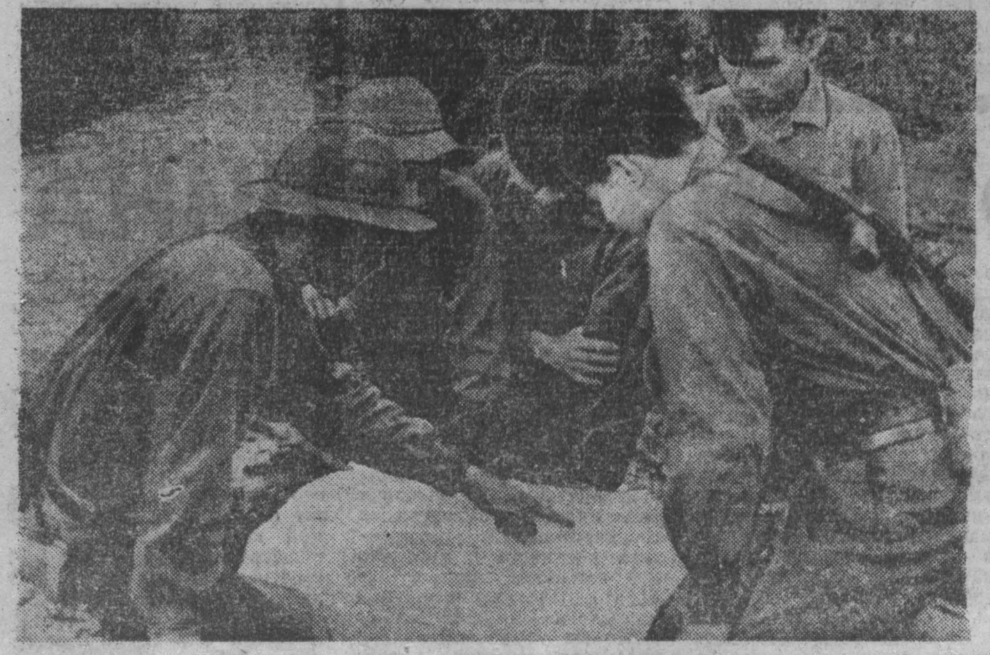
Ожесточенные сражения развернулись на северном плацдарме Южного Вьетнама. В наступательных операциях участвуют крупные ракетно-артиллерийские части армии освобождения. НА СНИМКЕ: совещание командиров подразделений НВСО перед наступлением на опорный пункт американо-сайгонских войск.

Г. ГЕРАСИМОВ, политический обозреватель АПН.