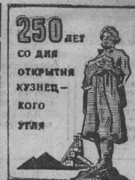
250 ДНЕЙ СО ДНЯ ОТКРЫТИЯ КУЗНЕЦКОГО ГОРОДА УГЛЯ

В остальных районах и во всех трех трестах суточная прибавка на пахоте составляет 100—400 гектаров, т. е. столько, сколько должно быть вспашено за сутки в одном—двух хозяйствах.