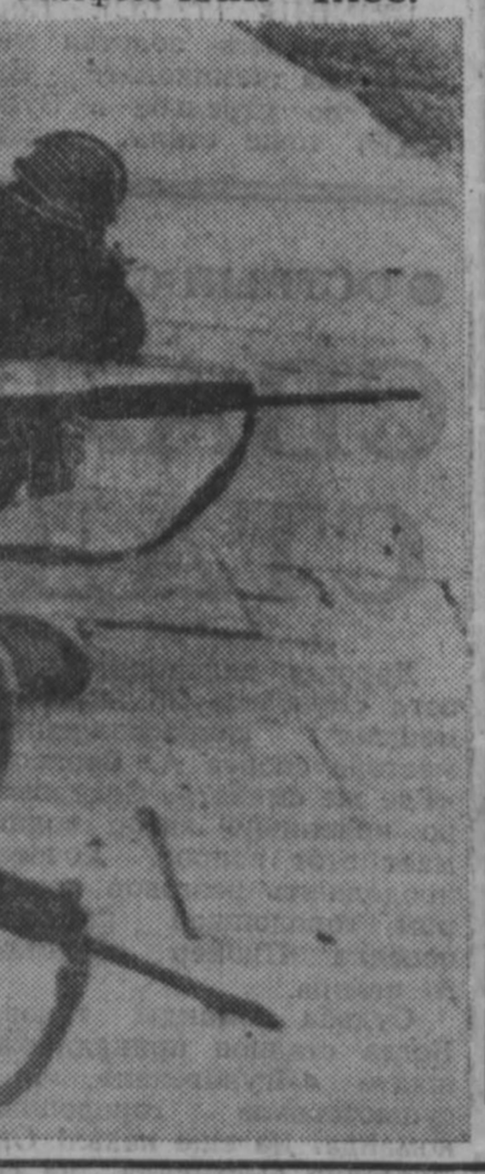
СНИМКИ: английские солдаты заняли огневую позицию на одной из улиц Белфаста.

В Северной Ирландии при поддержке правительства в Лондоне объявлено о введении в действие «закона о чрезвычайных полномочиях», на основании которого разрешено брать под стражу любое «подозрительное лицо».