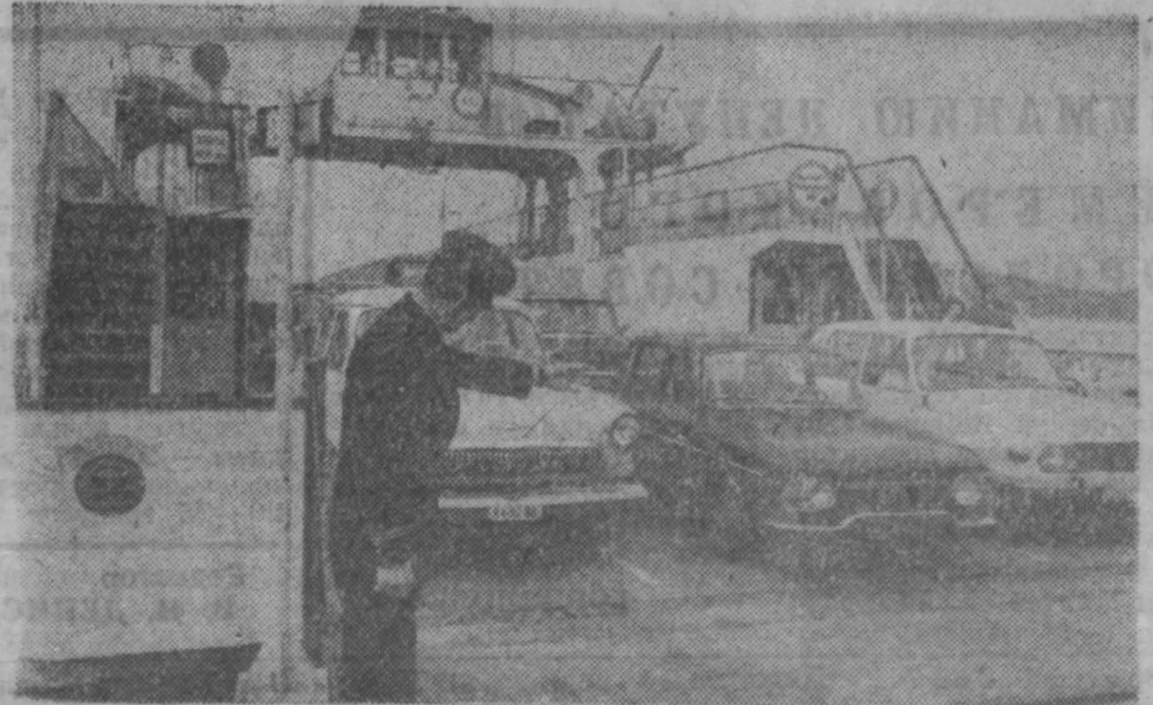
С наступлением хорошей погоды началось судоходство на Вататоне, из Тиханского порта отправился первый паром в Санто.