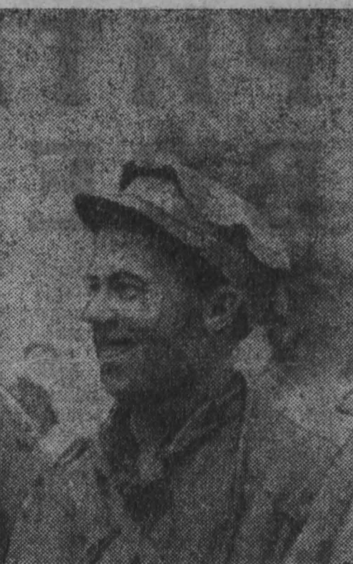
г. Ленинск-Кузнецкий.