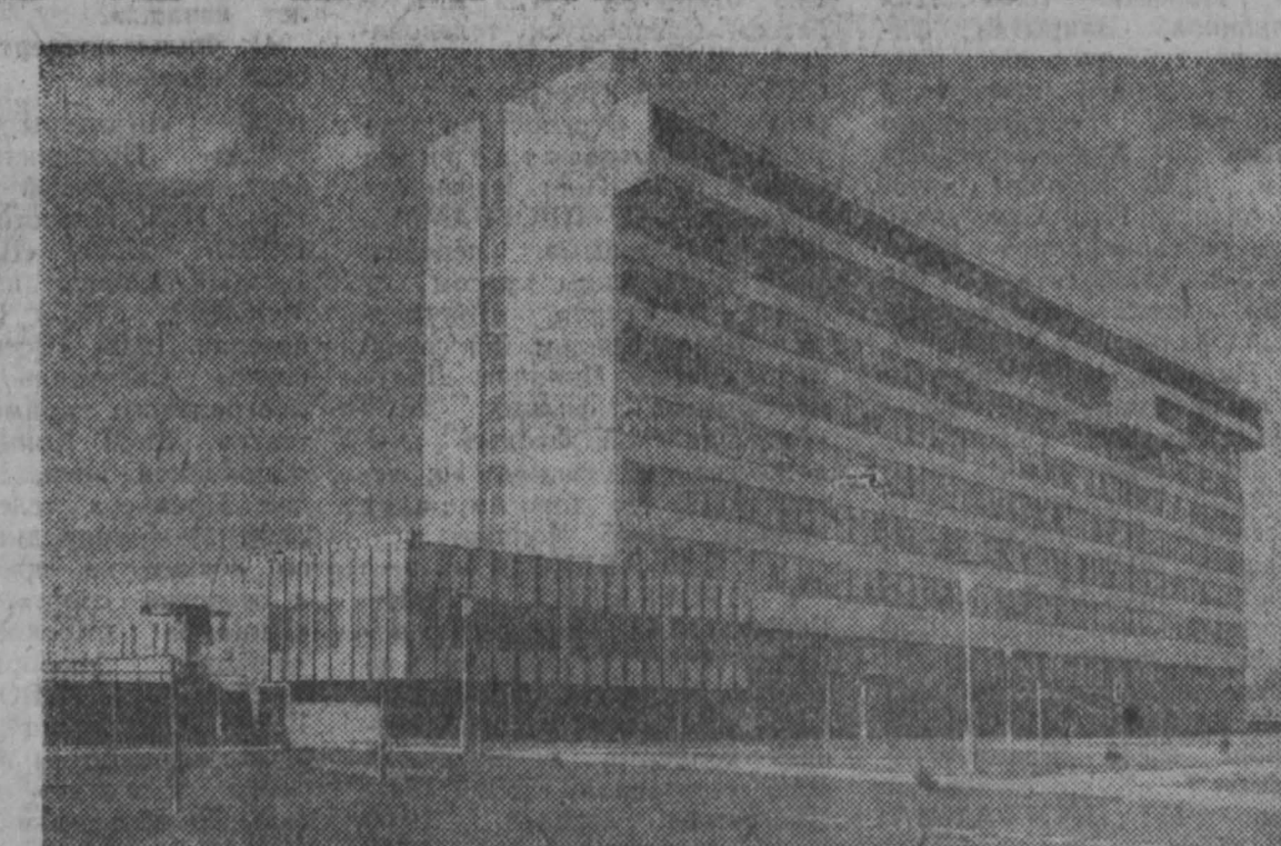
Год тому назад в Цегеле состоялось торжественное открытие больницы на 476 койки. Больница, построенная при капитализме, в 1962 миллионы форинтов, обслуживает около 140 тысяч жителей Цегеле и его окрестностей.