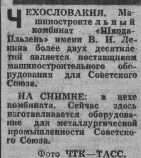
ЧЕХОСЛОВАКИЯ. Машиностроители и их комбинат «Шкода».

Валютные биржи ФРГ закрыты. Банки производят только самые необходимые операции.