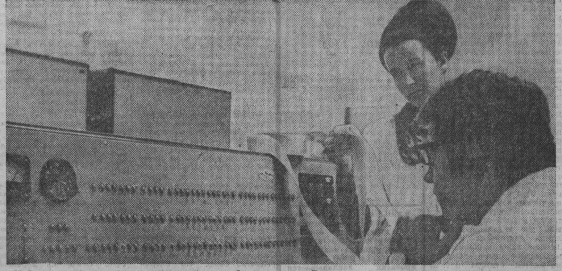
Информационно-вычислительный центр комбината «Кузбассуголь» освоил и решает уже целый комплекс задач: планирование профилактических ремонтов, маршевые расчеты, автоматизацию конвейерных линий и другие.

Значительно лучше и быстрее велось в прошлом месяце сооружение общеобразовательных школ. Индустриальный план перевыполнен почти на 20 процентов. На большинстве школьных объектов отделочные работы