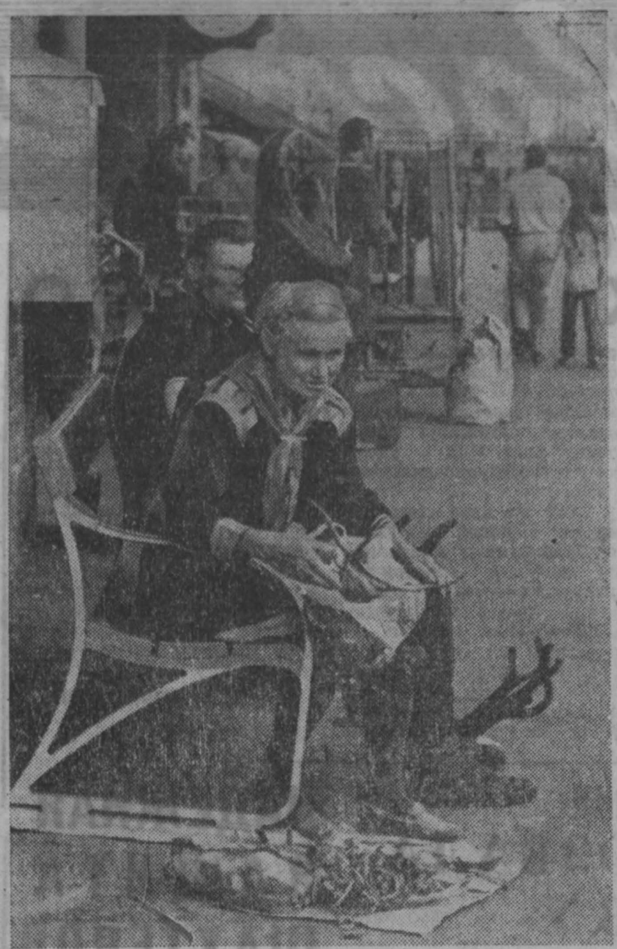
ШВЕЦИЯ. Продажа сувениров. Чтобы свести копья с копиями, этой пожилой женщине приходится долгие часы просиживать на улицах города Кируна, предлагая туристам незамысловатые изделия народных умельцев.

лению добрых отношений между этими двумя странами, но и внесет полезный вклад в дело поддержания и защиты мира в юго-восточной Азии. Тот факт, что две ведущие, неприсоединившиеся страны, Индия и ОАР, подчеркивается в заявлении, заключила договоры с ведущим государством социалистического мира, показывает, что сама жизнь приводит к выводу, что тесные и дружественные отношения с миром социализма — самый надежный путь, для по которому, неприсоединившиеся страны действительно могут обеспечить свою независимость и суверенитет».