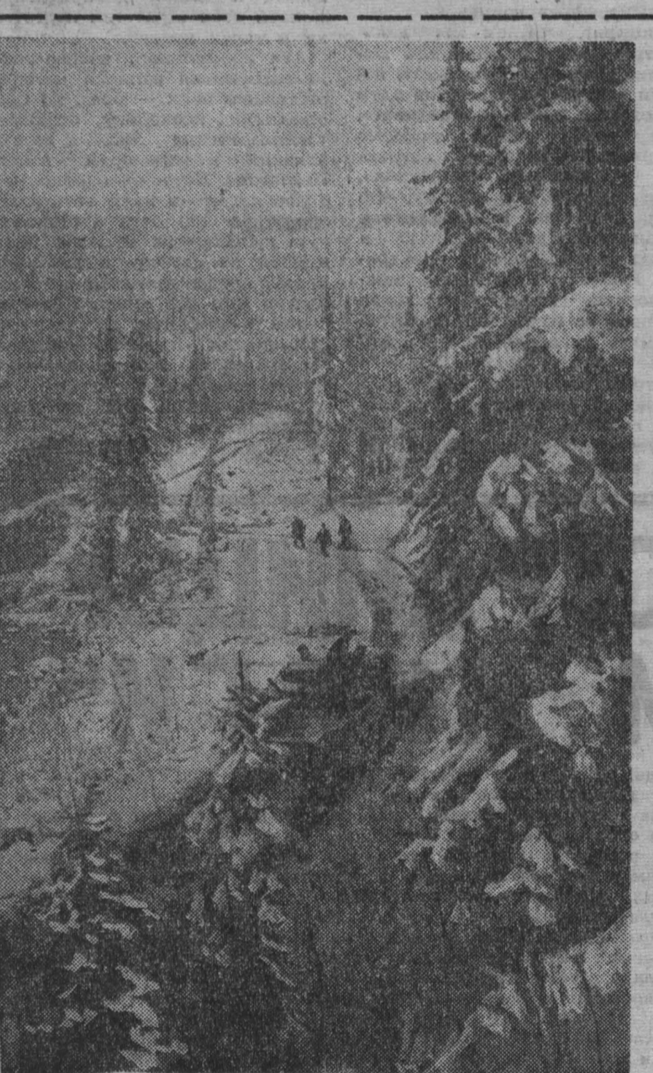
В горах Алатау