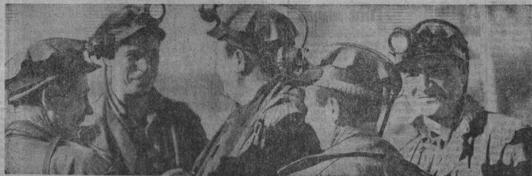
г. Белово.