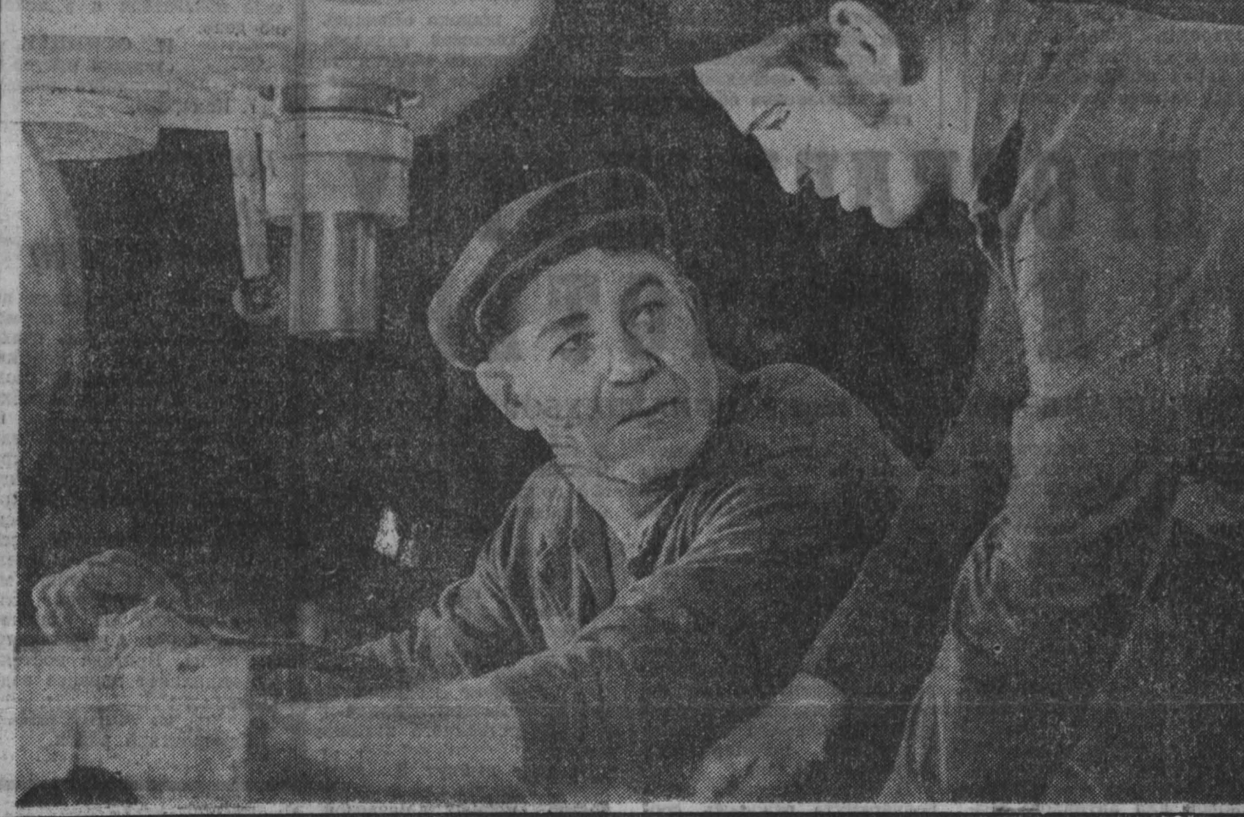
Коллектив участка № 14 Промышленского завода шахтной автоматики — один из лучших на предприятии.

Вчера в Междуреченске прошел ленинский день. «Дню шахтера — ударный труд» — таким был его девиз на угольных предприятиях горняцкого города.