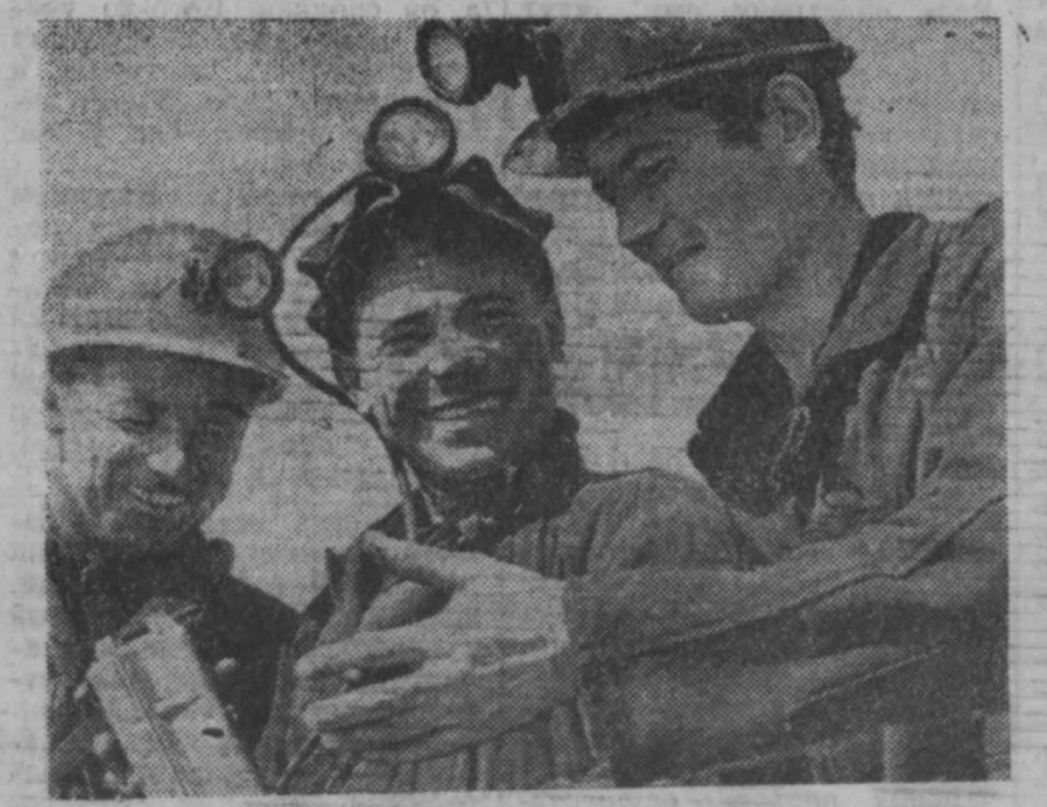
ШАХТИНСК. Угольщики Карагадинского бассейна досрочно завершили полугодовую программу по добыче топлива. С начала года выдано на-гора сверх плана более 800 тысяч тонн угля.

Победители соревнования по профессиям — механизаторов, рабочих, колхозников, бригадиров и их помощников будут также награждены знаками «Отличник социалистического соревнования сельского хозяйства РСФСР», Почетные грамоты управления сельского хозяйства облисполкома и облисполкома, дипломы лучшего по профессии. Оперативные итоги областного соревнования на уборке урожая, заготовках сельскохозяйственных продуктов и вспашке зяби будут подводиться понаедавно, а окончательные — после завершения жатвы.