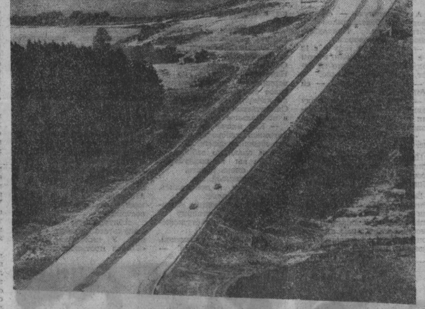
Сдан в эксплуатацию первый двадцатикиллометровый участок автострады, которая пересечет всю Чехословакию с запада на восток. Новая магистраль пройдет через такие крупные экономические центры страны, как Прага, Нитрава, Брно, Братислава. Сооружение дороги ведется с учетом всех требований современного скоростного транспорта.

Решением сената эти радиостанции будут финансироваться из правительственных фондов. В 1972 году этим радиостанциям выделяется 35 млн. долларов.