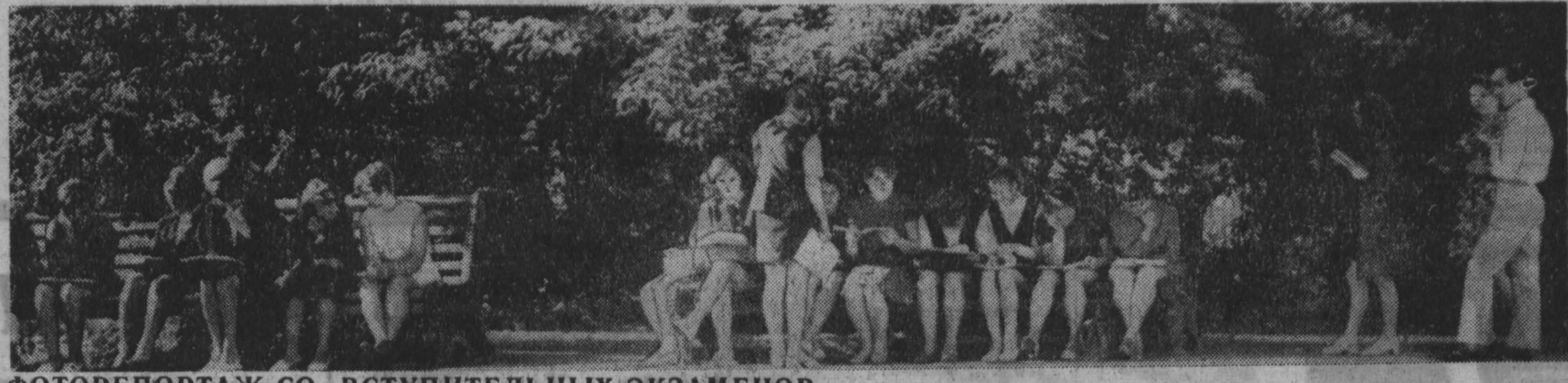
ФОТОРЕПОРТАЖ СО ВСТУПИТЕЛЬНЫХ ЭКЗАМЕНОВ

Клуб ГРП РУДИЧНОГО РАЙОНА. ОДИН ШАНС ИЗ ТЫСЯЧИ (17, 19, 21). ДК СТРОИТЕЛЕЙ. В ЛАЗОРОВОЙ СТЕПИ (17, 19, 21).