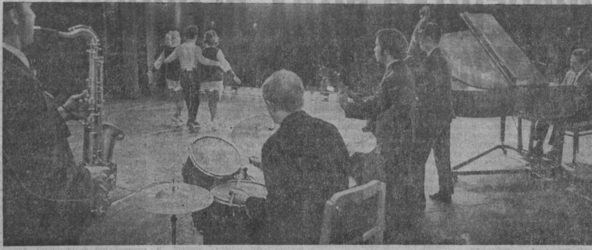
Дворец культуры Западно-Сибирского металлургического завода открылся сравнительно недавно, но уже считается одним из лучших в Кузбассе. Здесь все есть для хорошего отдыха: драматический коллектив и ансамбль песни и пляски, университет культуры и библиотечка, фото- и кинокружок, балетная студия.