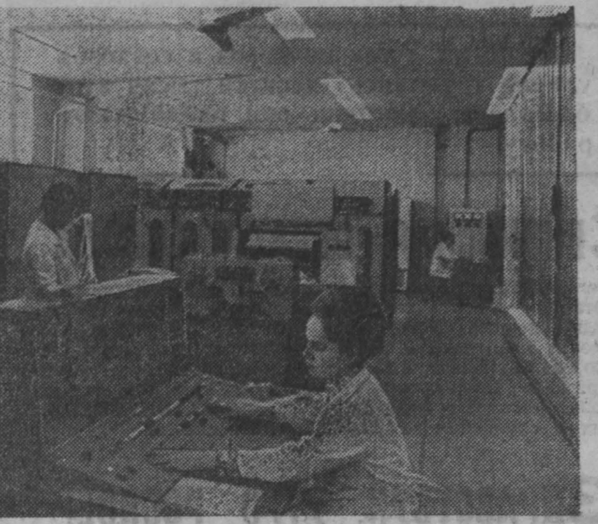
На пермском заводе «Камкабель» создается автоматизированная система управления производством (АСУ).