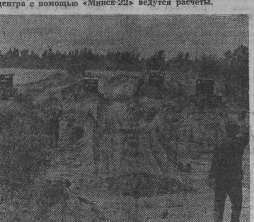
УЗБЕКСКАЯ ССР. Много городов и селений погребали под себя в старину движущиеся барханы.