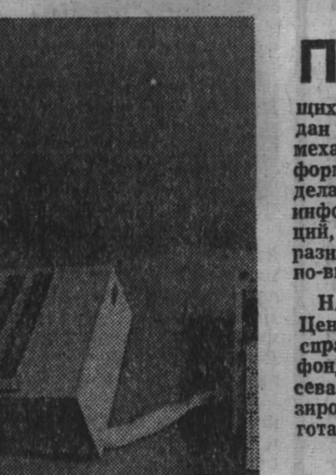
ПЕРМСКИМ научно-исследовательским институтом управления

Я применяю в саду и на огороде против вредных насекомых ядохимикаты.