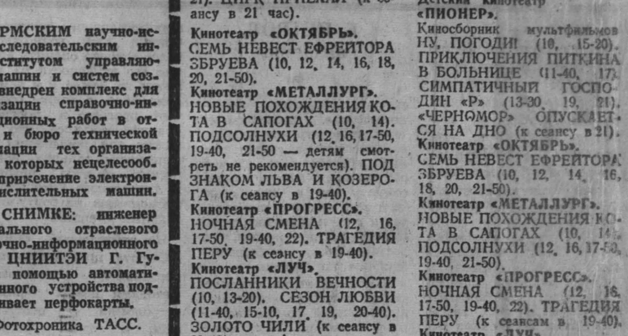
ПЕРМСКИМ научно-исследовательским институтом управления

Я применяю в саду и на огороде против вредных насекомых ядохимикаты.