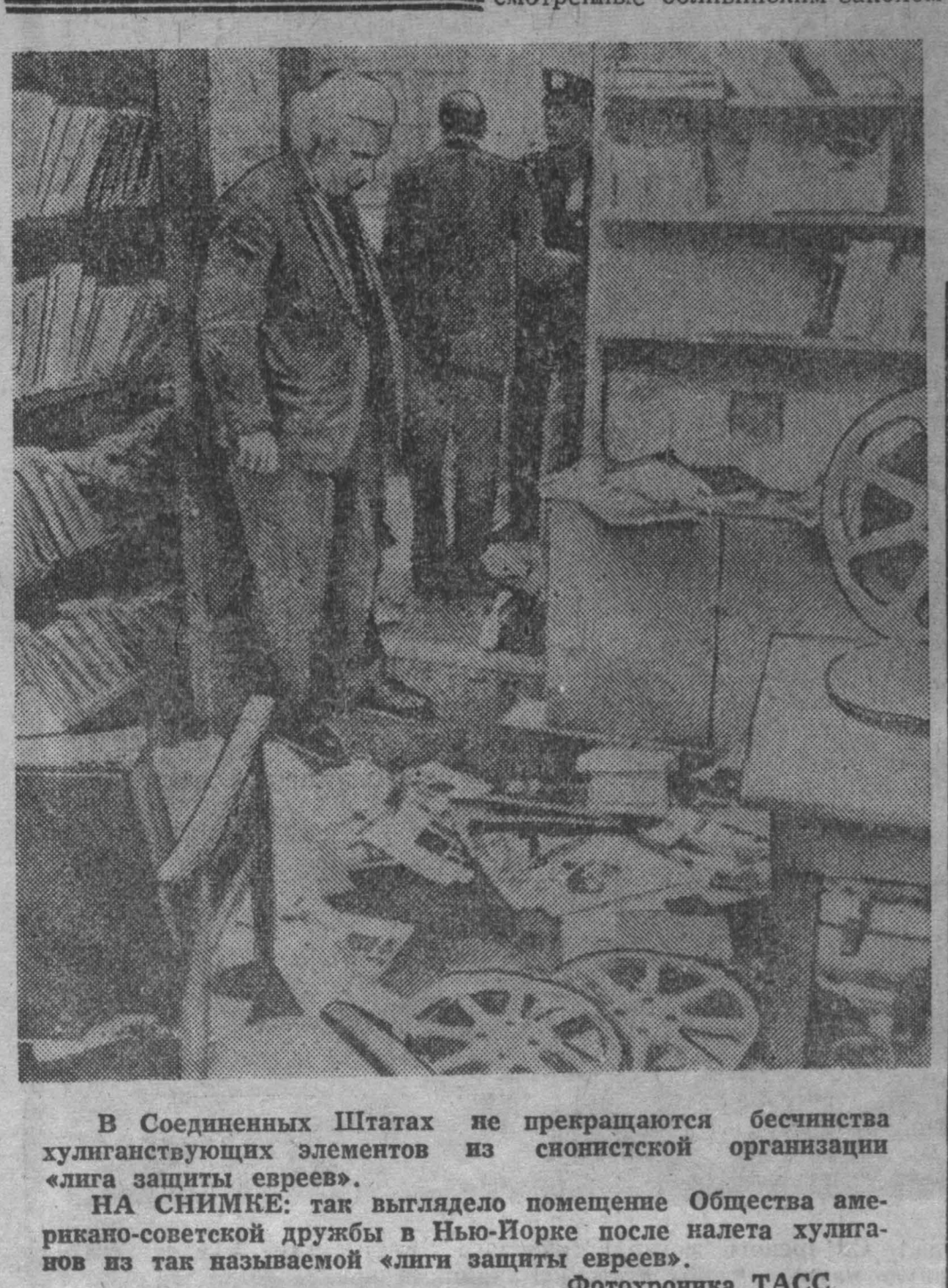
В Соединенных Штатах не прекращаются бесчинства хулиганствующих элементов из сионистской организации «Лига защиты евреев». НА СНИМКЕ: так выглядело помещение Общества американо-советской дружбы в Нью-Йорке после налета хулиганов из так называемой «лиги защиты евреев».