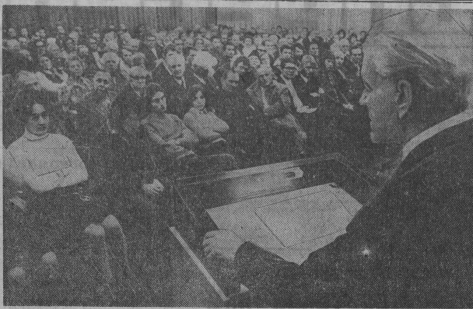
Активизация врагов сил, пытающихся помешать политике разрядки напряженности в Европе, нормализации отношений ФРГ с социалистическими странами, требует от западногерманских демократов сплоченных ответных действий.

НА СНИМКЕ: на собрании в Золлингере первый секретарь ЦК КПГ Макс Рейман призывает коммунистов, социал-демократов, членов профсоюзов, студенческие организации и молодежь выступить за скорейшую ратификацию договоров с Советским Союзом и Польшей.