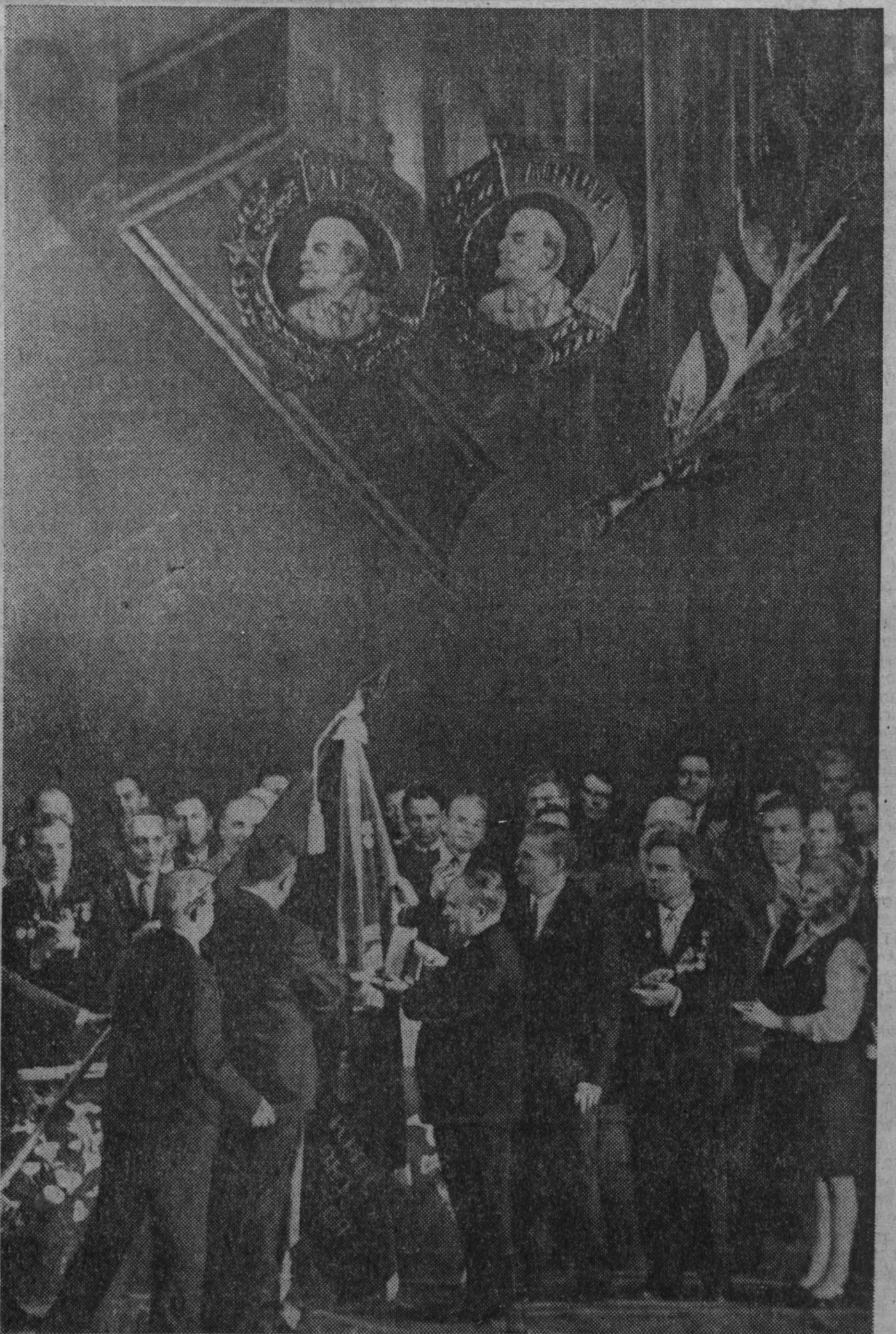
Г. И. Воронов прикрепляет второй орден Ленина к знамени Кемеровской области.