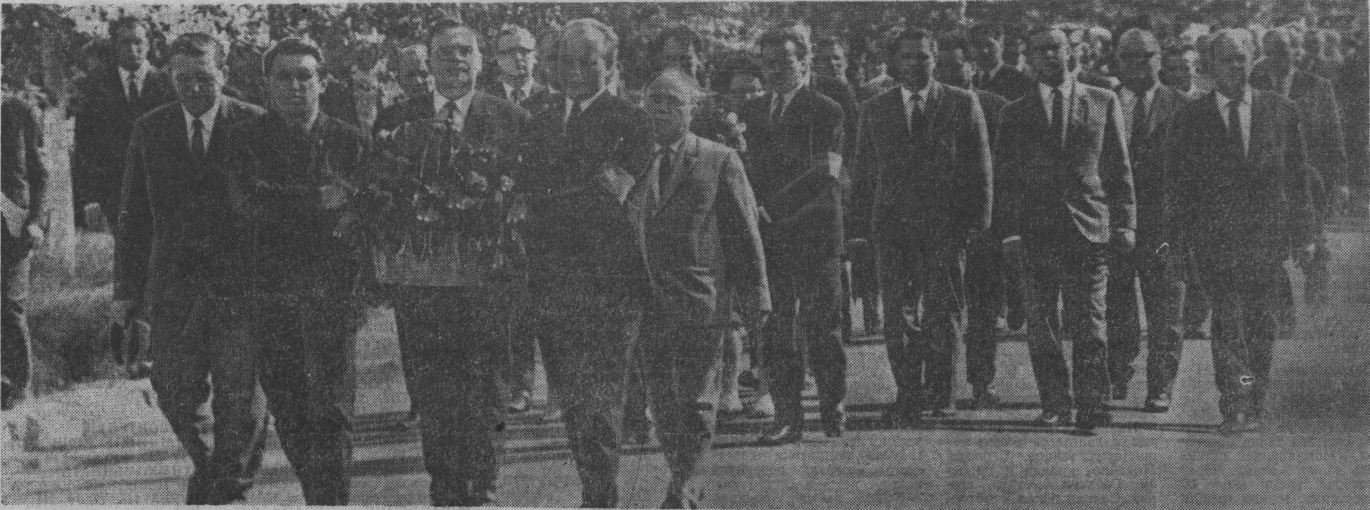
Эти снимки сделаны в Кемерово 22 июня у памятника воинам-кузбассовцам, погибшим в годы Великой Отечественной войны. Венок от Совета Министров РСФСР возлагает член Политбюро ЦК КПСС, Председатель Совета Министров РСФСР Г. И. Воронов. Венок от областного комитета КПСС и облисполкома возлагает член ЦК обкома партии А. Ф. Ештокин и члены бюро обкома КПСС.