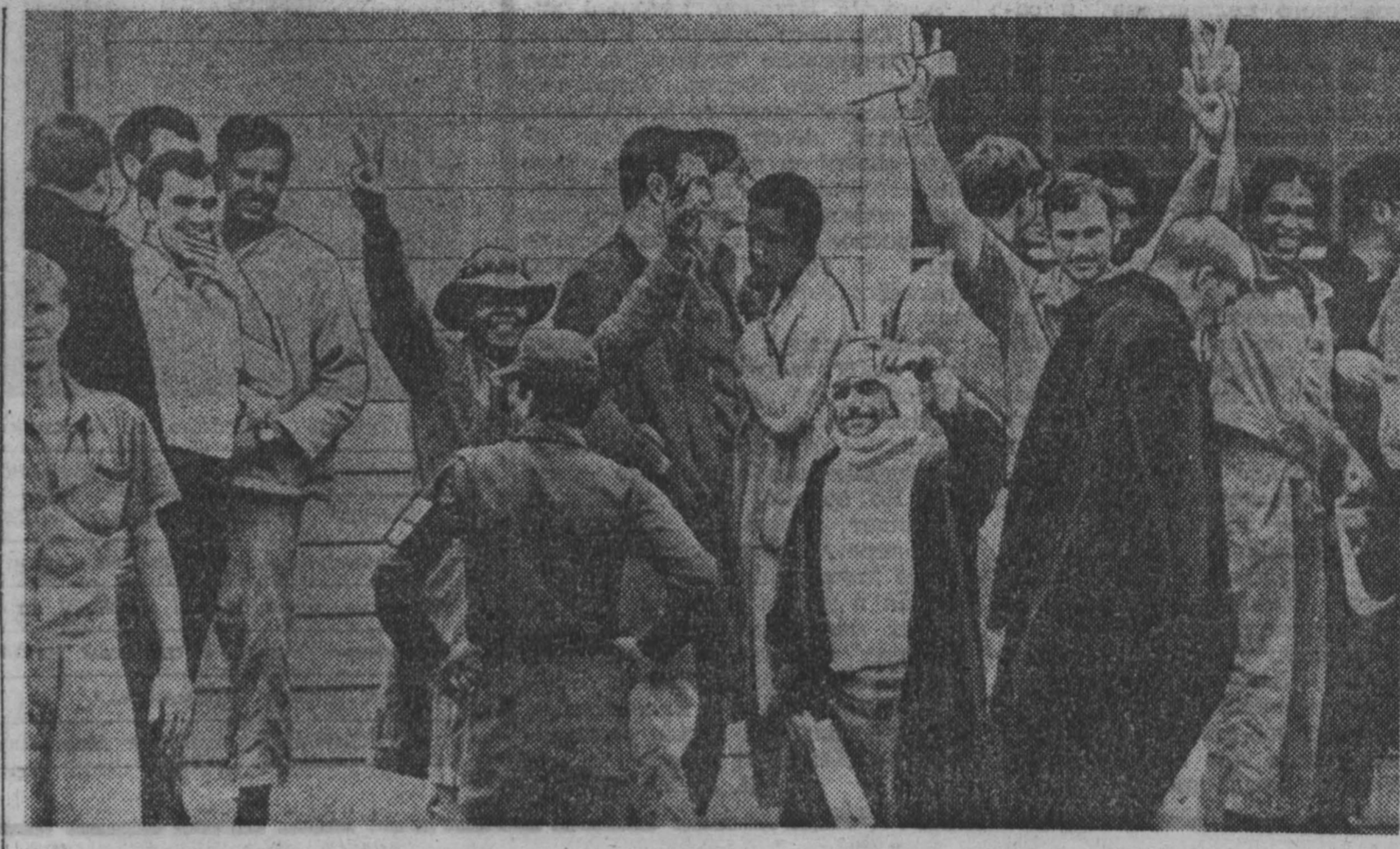
НА СНИМКЕ — американские солдаты-протестующие в Асуане.