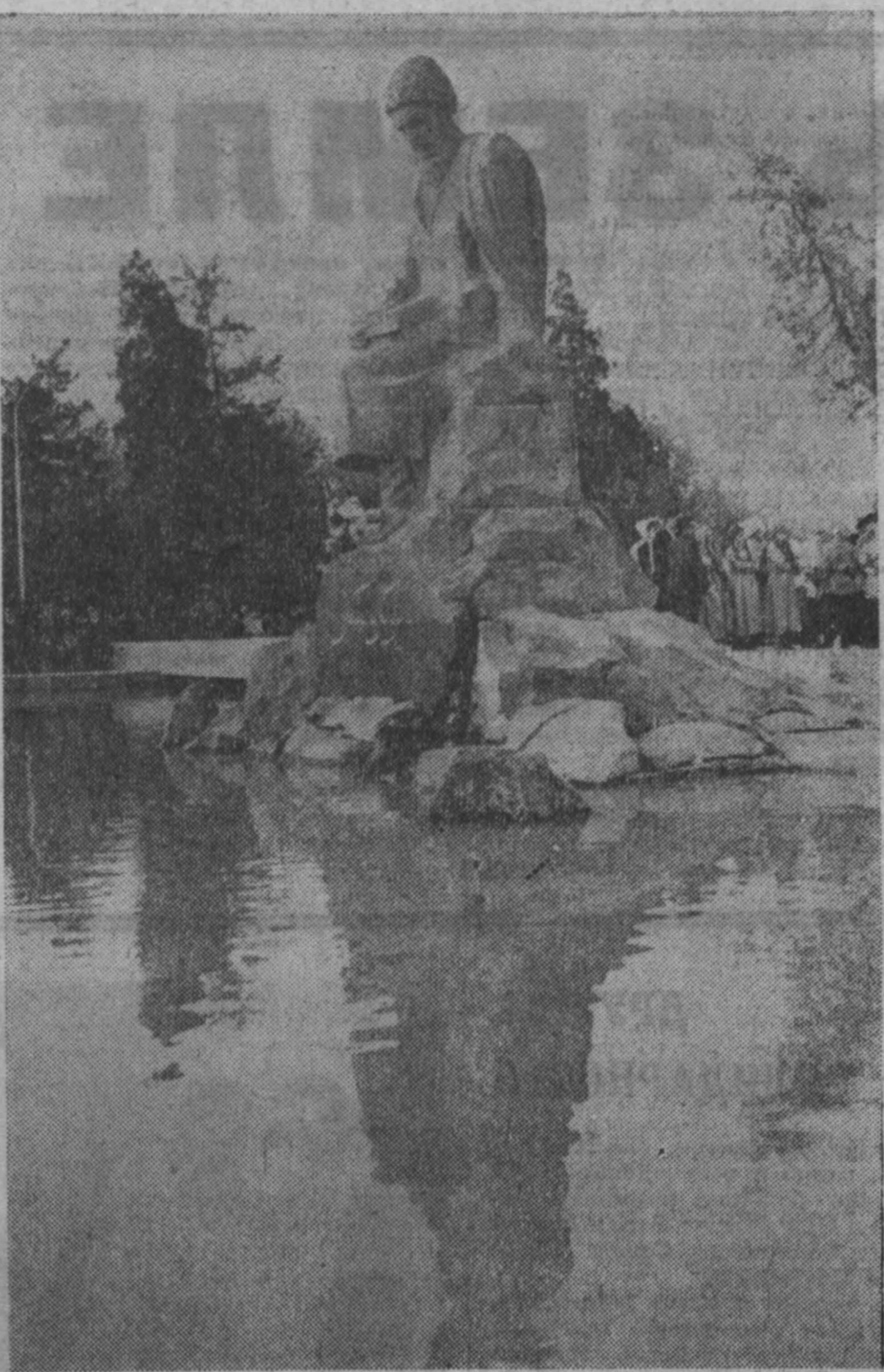
В центре Ашхабада, на проспекте Свободы, в чистом сквере открыт памятник классику туркменской поэзии Махтумкули. Фигура великого поэта и мыслителя вырублена из огромной каменной глыбы, в ансамбль входят стела, облицованная красным гранитом, бронзовыми буквами на ней выведены строки из стихотворения поэта: «Потомкам запомнится Махтумкули — поистине стел об устами Туркмени...» НА СНИМКЕ: памятник Махтумкули.