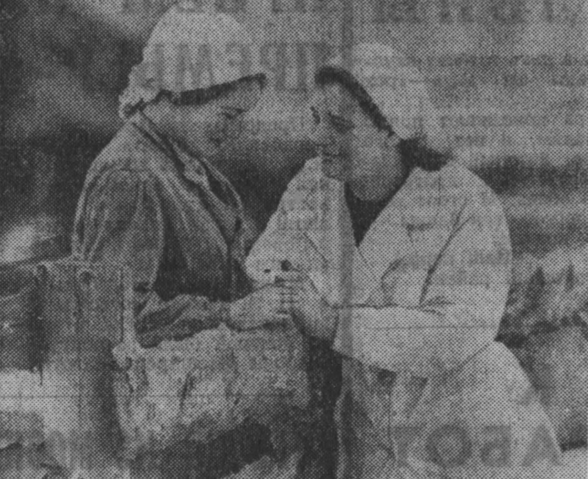
ФОТО ДНЯ ГОРОДУ — РАСТИ

В новой пятилетке добыча руды на Саянском руднике и известняков на Гурьевском значительно увеличится. Вырастут мощности металлургического завода. Завод «Труд» построит четвертую известковую печь и два цеха для производства цинковых белил. Гурьевский участок Чумльского леспрохоза превратится в самостоятельное предприятие, а Гурьевский леспрохоз начнет вырубать древесные пилы. В конце пятилетки будет закончено проектирование Гурьевского труболитейного завода.