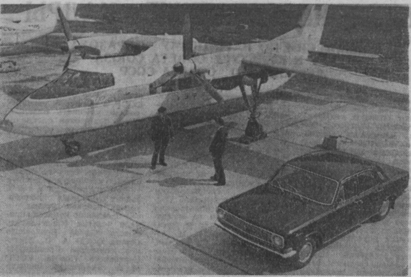
МОСКВА. Легкий пассажирский самолет «БЕ-30», рассчитанный на 14-15 пассажиров, называют воздушным микроавтобусом. Он предназначен для местных авиалиний. Эта машина с двумя турбовинтовыми двигателями, высокая скорость — 460 километров в час. Для разбега требуется 200-250 метров, пробег при посадке — всего 130 метров. НА СНИМКЕ: самолет «БЕ-30».