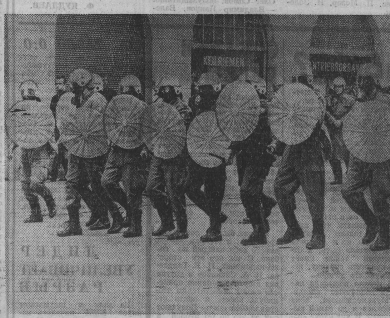
Своим обликом на первый взгляд эти люди напоминают вышедших на турнир средневековых рыцарей. Однако как далеко они от существовавших тому времени благородных идеалов... Так