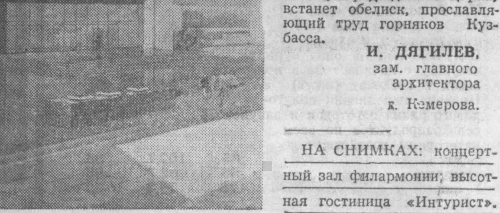
НА СНИМКАХ: концертный зал филармонии; высотная гостиница «Интурист».