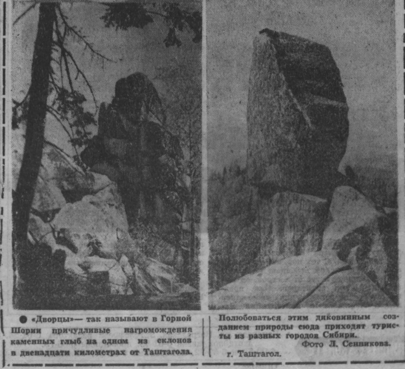
«Дворцы» — так называют в Горной Шории причудливые нагромождения каменных глыб на одном из склонов в двенадцати километрах от Таштагола.